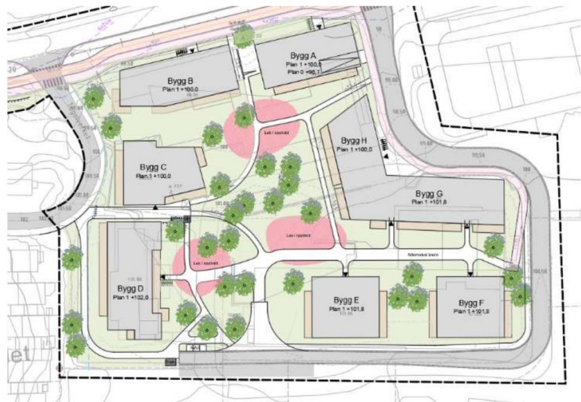
Figur 1: Ny Illustrasjonsplan

Det etableres vendehammer for å ivareta adkomstbehov for kjøretøy til næringsseidommene og for renovasjonsbil.