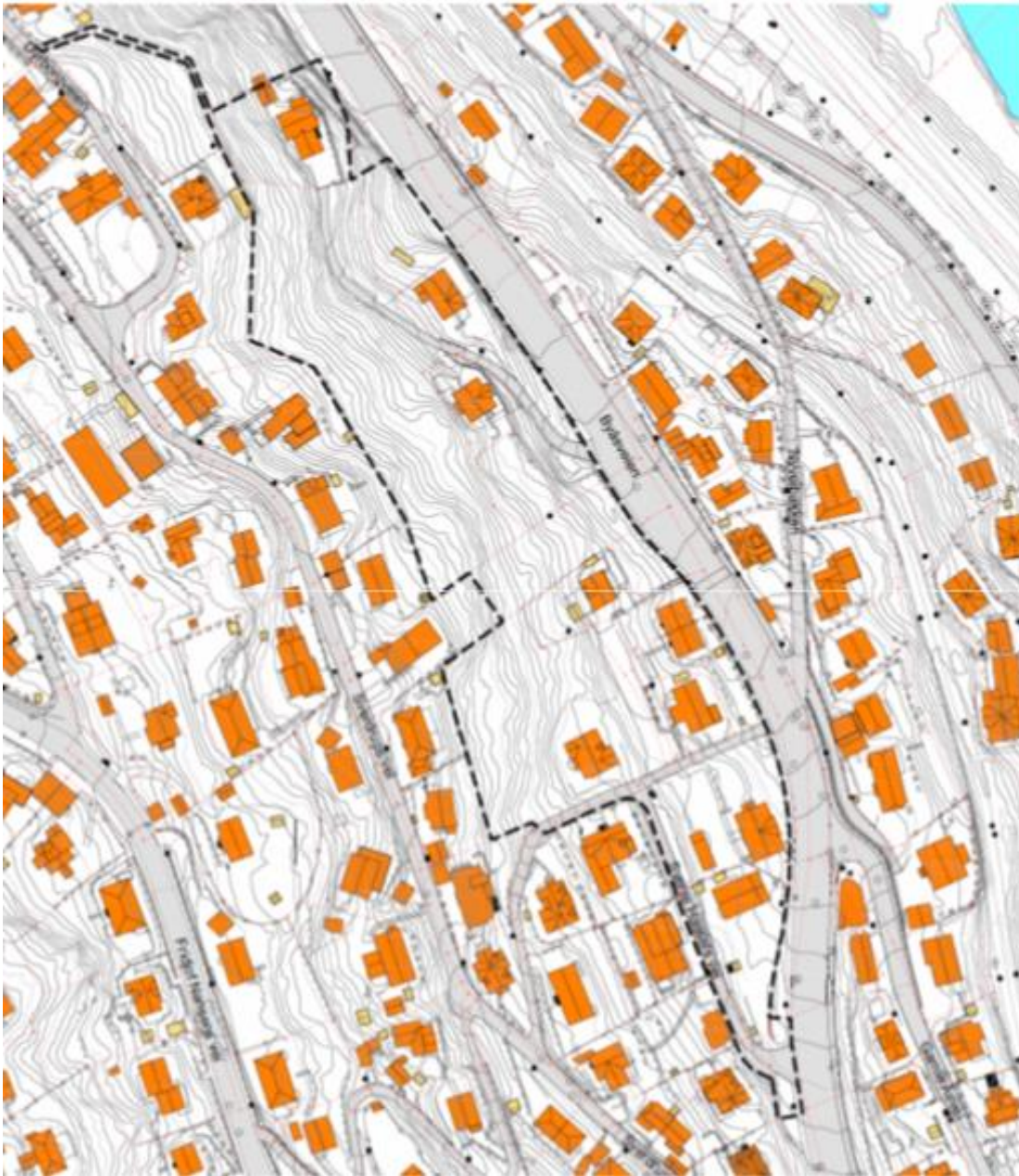
Figur 2. Ny plangrense.