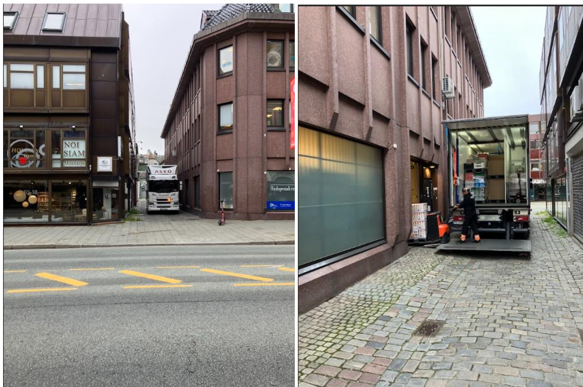
Stor lastebil av typen ASKO som leverer dagligvarer til eksisterende varemottak i Nedre Enkeltskillingsveita.

Hvit pil viser dagens kjøremønster for varelevering, som foreslås videreført i ny plan. Lastebilene rygger inn i Nedre Enkeltskillingsveita fra Olav Tryggvasons gate, og kjører deretter ut igjen i Olav Tryggvasons gate. Pilene viser kjøremønster for lastebiler som kommer fra vest og kjører østover i Olav Tryggvasons gate. Planområdet er markert med svart strek.