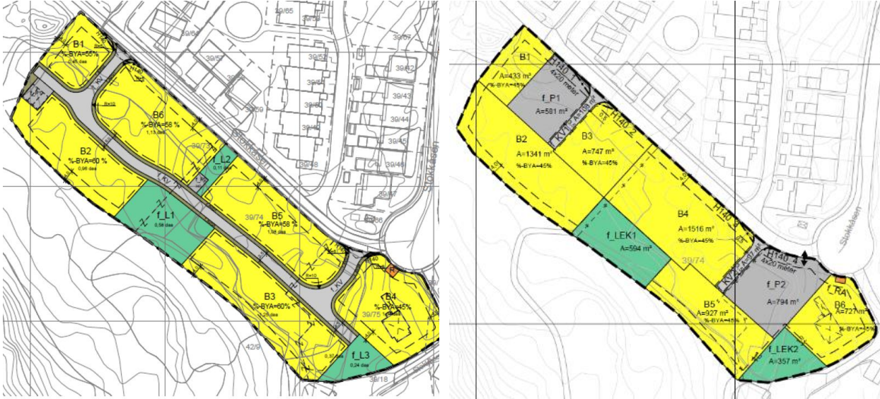
Figur 1: Tidligere plankart til venstre og forslag til nytt plankart til høyre

Parkeringsplassene var i planforslaget som lå ute til offentlig ettersyn plassert foran hver bolig med innkjøring fra en internvei. Som følge av vedtaket fra bygningsrådet er parkeringen i nytt forslag foreslått plassert på to større parkeringsplasser i hver ende av planområdet. Endringen medfører at det ikke lenger vil være behov for internveien, den er derfor tatt ut. Som erstatning for internveien vil det etableres en gangforbindelse gjennom området som vil være kjørbart for brannbil.