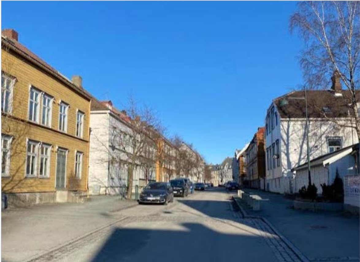
Østersunds gate, sett østover fra krysset Fjæregata