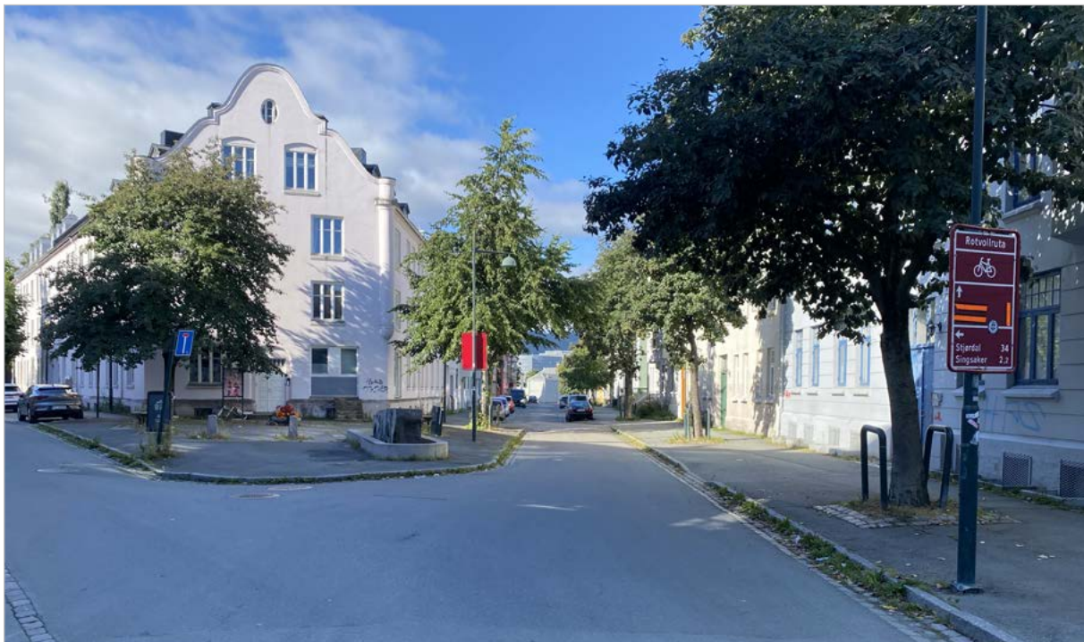
Østersunds gate, sett vestover fra Ulstadløkkveien.

Østersunds gate ligger vest i bydel Lademoen, og løper parallelt med Innherredsveien. Den strekker seg i overkant av 200 meter fra Fjæregata og østover til Ulstadløkkveien, og ender ut i et "strykejernkryss" med en liten åpen plass med kunstnerisk utsmykning. Gregus gate krysser Østersunds gate omtrent midtveis. Mot nord grenser gata mot jernbanen og Svartlamon. Mot vest ender gata i Strandveiparken, hvor det i dag er en liten park (Gullparken). Gata fremstår som en boliggate, i tillegg til at bydelshuset og Lademoen barnehage ligger i gata. Trondheim kommune er eier av flere bygårder langs gata, og boligene benyttes som kommunale utleieboliger. Deler av gata har parkeringslommer langs fortau. En rekke av trær langs gatas vestsida gir en grøntstruktur i sommerhalvåret.