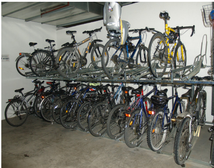
Figur 2 Innendørs sykkelparkering i to etasjer

Bebyggelsens eget behov for sykkelparkering skal normalt ikke henvises til offentlig gate. Statens vegvesens håndbok 233, Sykkelhåndboka, viser sykkelparkeringsnormer som avviker noe fra Trondheim kommunes minimumsnorm. Sykkelhåndboka viser også utforming og dimensjonering av sykkelparkeringsplassene.