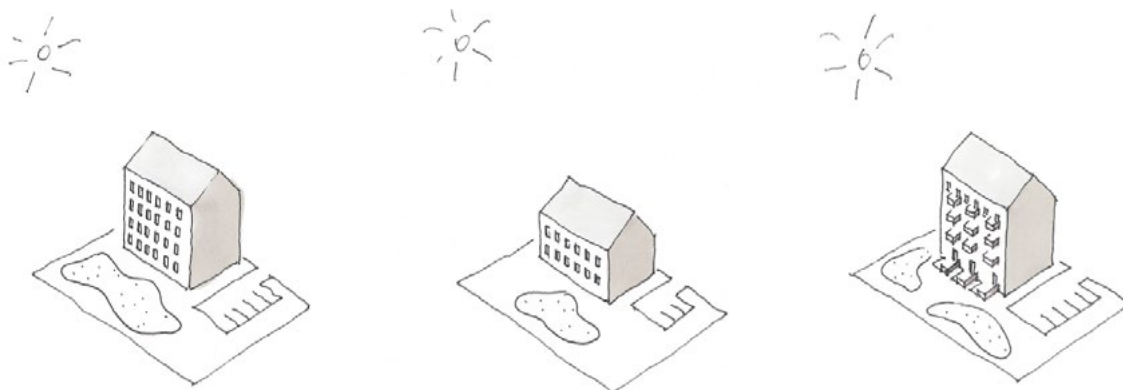
Figur 2 Størrelsen på uterommet avhenger av det samlede bruksarealet i boligbebyggelsen.

Beregningsgrunnlaget er tillatt bruksareal for boliger fratrukket areal til parkeringsplasser og areal som skal brukes til uterom som uterom.