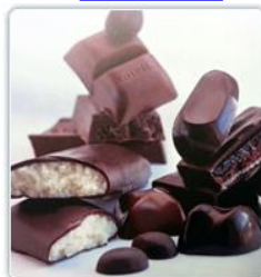
2008 Nidar AS