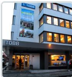
2018 Hedrende omtale Bolibyggelaget TOBB