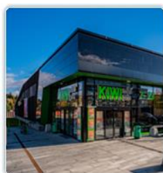
2018 Hedrende omtale KIWI Dalgård