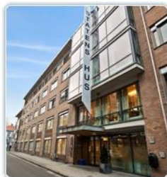
2016 Statens hus, Entra ASA