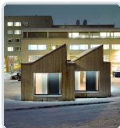
2016 Hedrende omtale ZEB, Living Lab