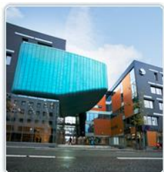
2011 Sparebank 1 SMN