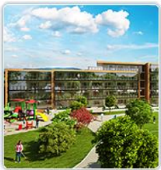
2014 Hedrende omtale Miljøbyen Granåsen