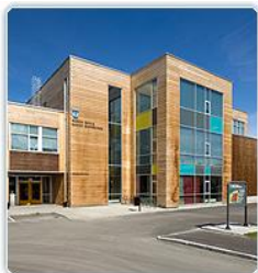
2009 Nardo skole og barnehage