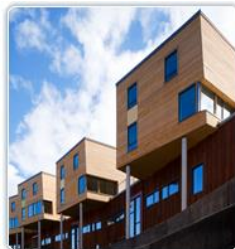
2012 Nye Berg studentby og Teknobyen studentboliger Studentsamskipnaden i Trondheim