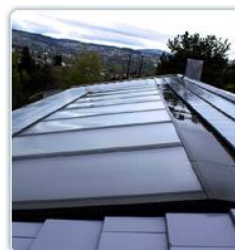
2016 Hedrende omtale Free Energy Innovation, Andersen og Sivertsen