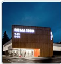
2014 Rema 1000 Kroppanmarka