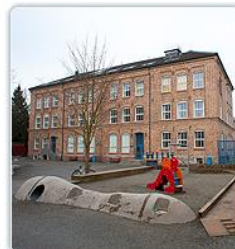
2012 Hedrende omtale Steinerskolen