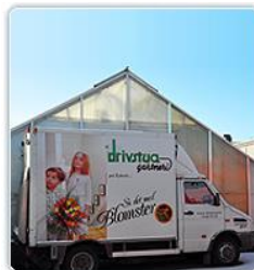
2011 Hedrende omtale Drivstua Gartneri AS