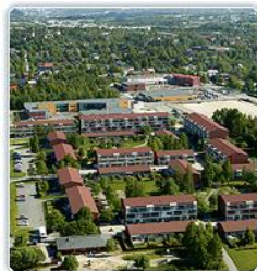
2009 Hedrende omtale Ustmyra Borettslag