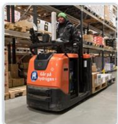
2018 Hydrogenprosjektet ASKO Midt-Norge