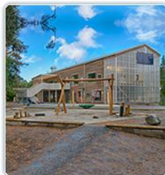
2015 Hedrende omtale Haukåsen barnehage