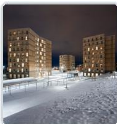
2017 Moholt 50|50 Studentsamskipnaden i Gjøvik, Alesund og Trondheim