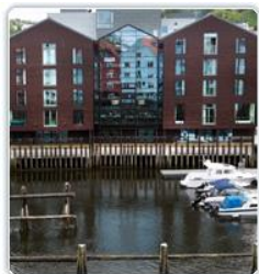
2013 Rica Bakklundet Hotel