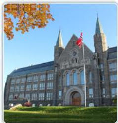
2015 Driftsavdelingen, NTNU