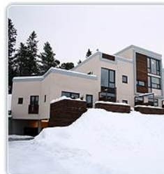
2007 Structura AS, Kulsås Amfi