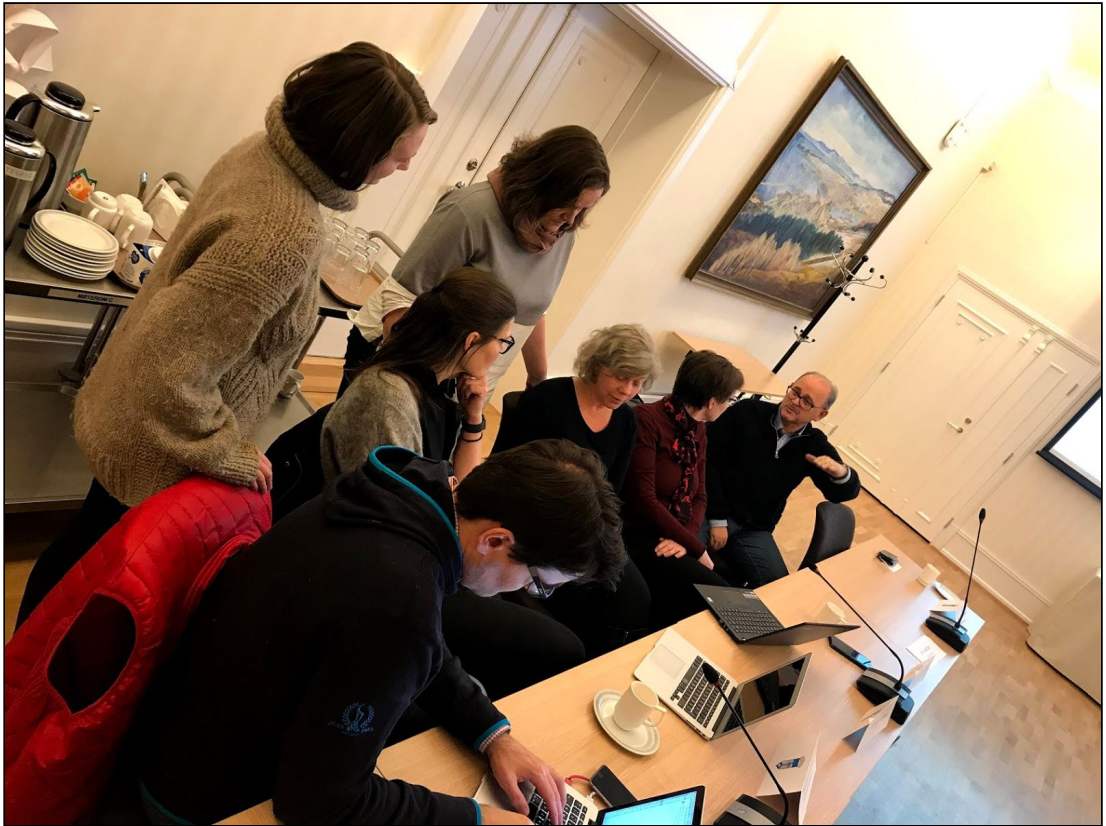
KFU arbeider med høringsuttalelse