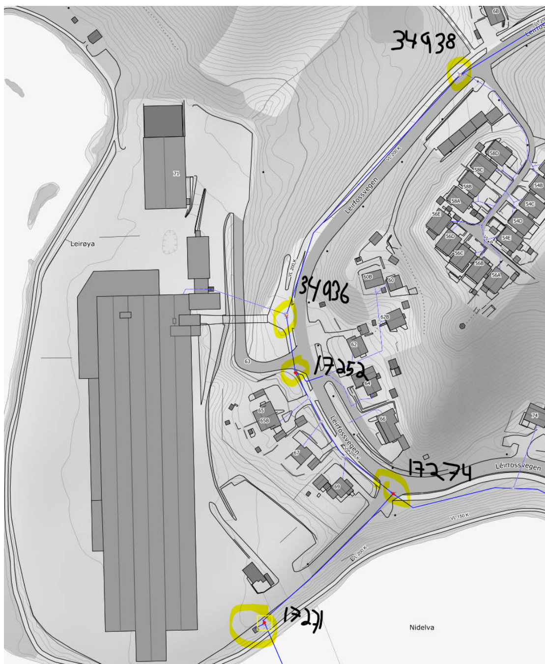
Figur: Leirfossvegen 71. Aktuell vannkum SID: 17274, 17252, 34936, 34938 og 17271

I forespørsel var det etterspurt brannvann fra kum 17289, men dette er en kum for spillvann. Kum 17252 er en brannvannskum rett ved og er inkludert i beregningene.