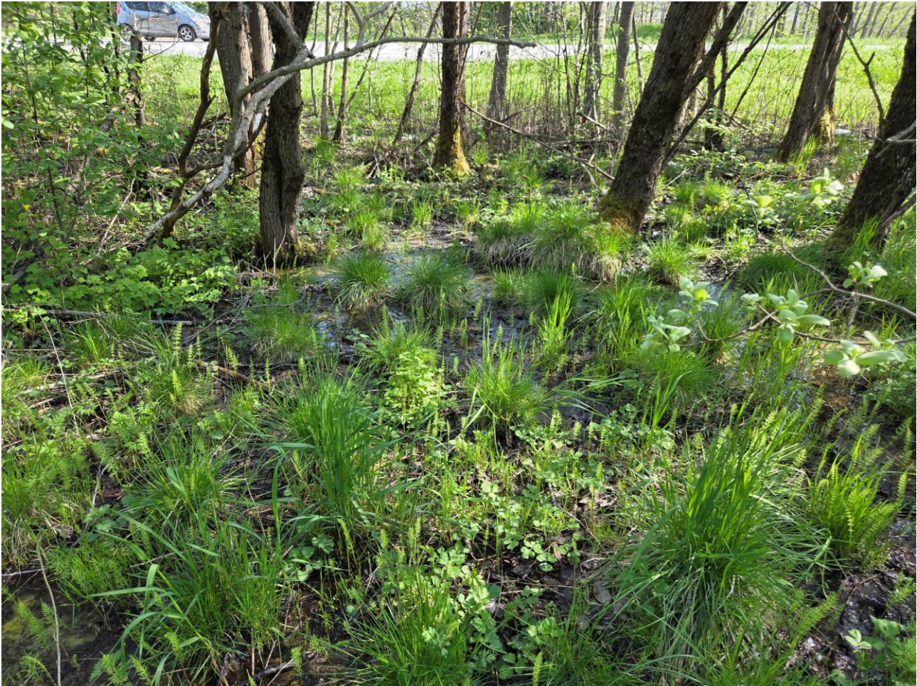
Figur 9: Lite sumpområde på vestsiden av Rv. 706. Marginalt som habitat i seg selv, men med mulig tilknytning til skogområder på nedsiden av veien.