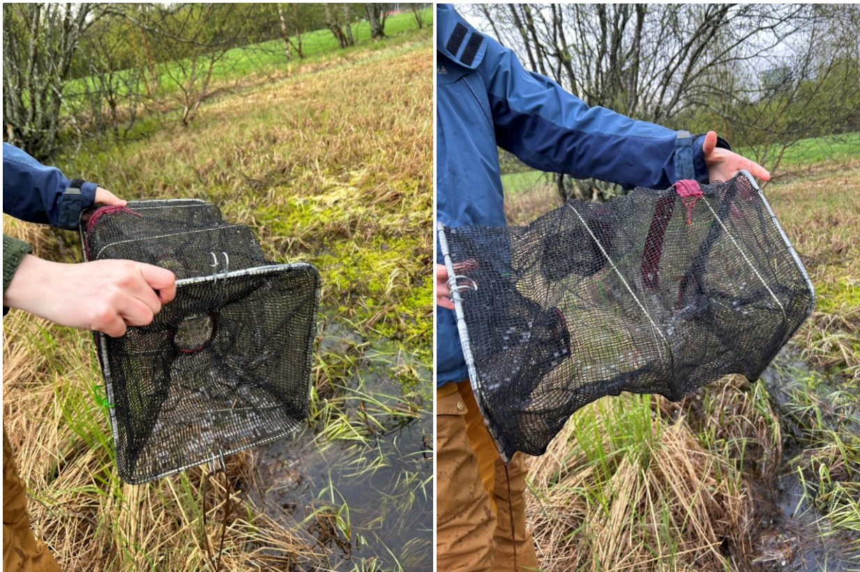
Figur 4a og 4b: Finmasket krepseteine ble brukt som fangstredskap. Ti stykker ble fordelt i dammen; fire i hjørnene, to på hver langside, og én på hver kortsida av den trapesformede dammen.