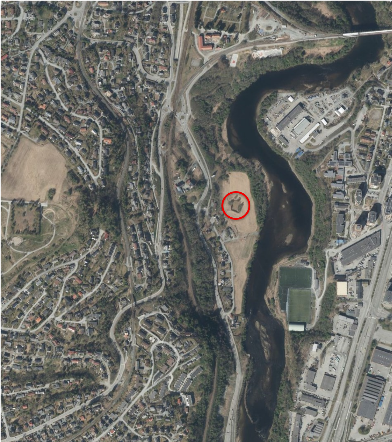
Figur 13: Flyfoto fra dagens situasjon. Isdammen i rød ring. Svært lite igjen av landbrukslandskapet. Skog og natur også sterkt redusert. Stor samlet belastning på salamander. Norgebilder.no