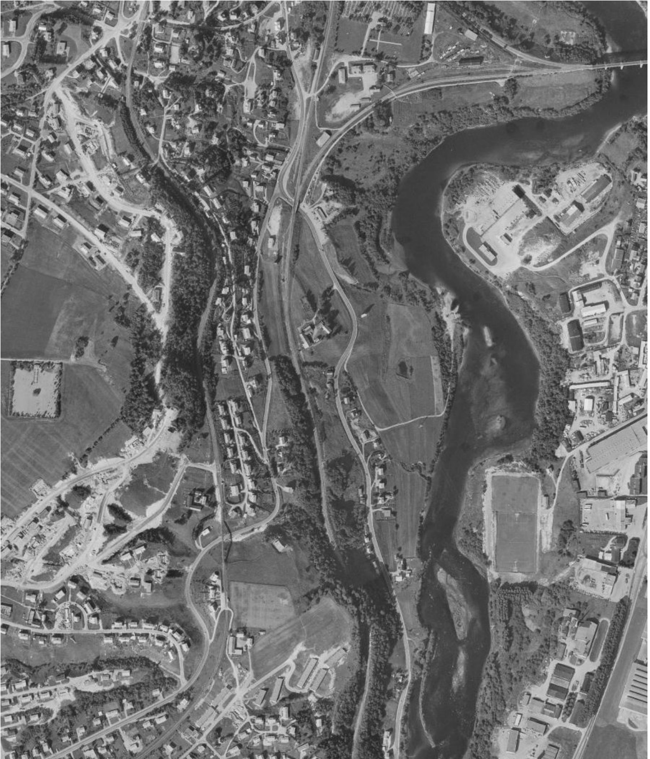
Figur: Flyfoto fra 1969. Mye byggeaktivitet, nye veier og boligfelter, og vassdrag lagt i rør. Sterkt endrede forhold for amfibier med tanke på leveområde og vandring. Tendens til gjengroing i Isdammen.