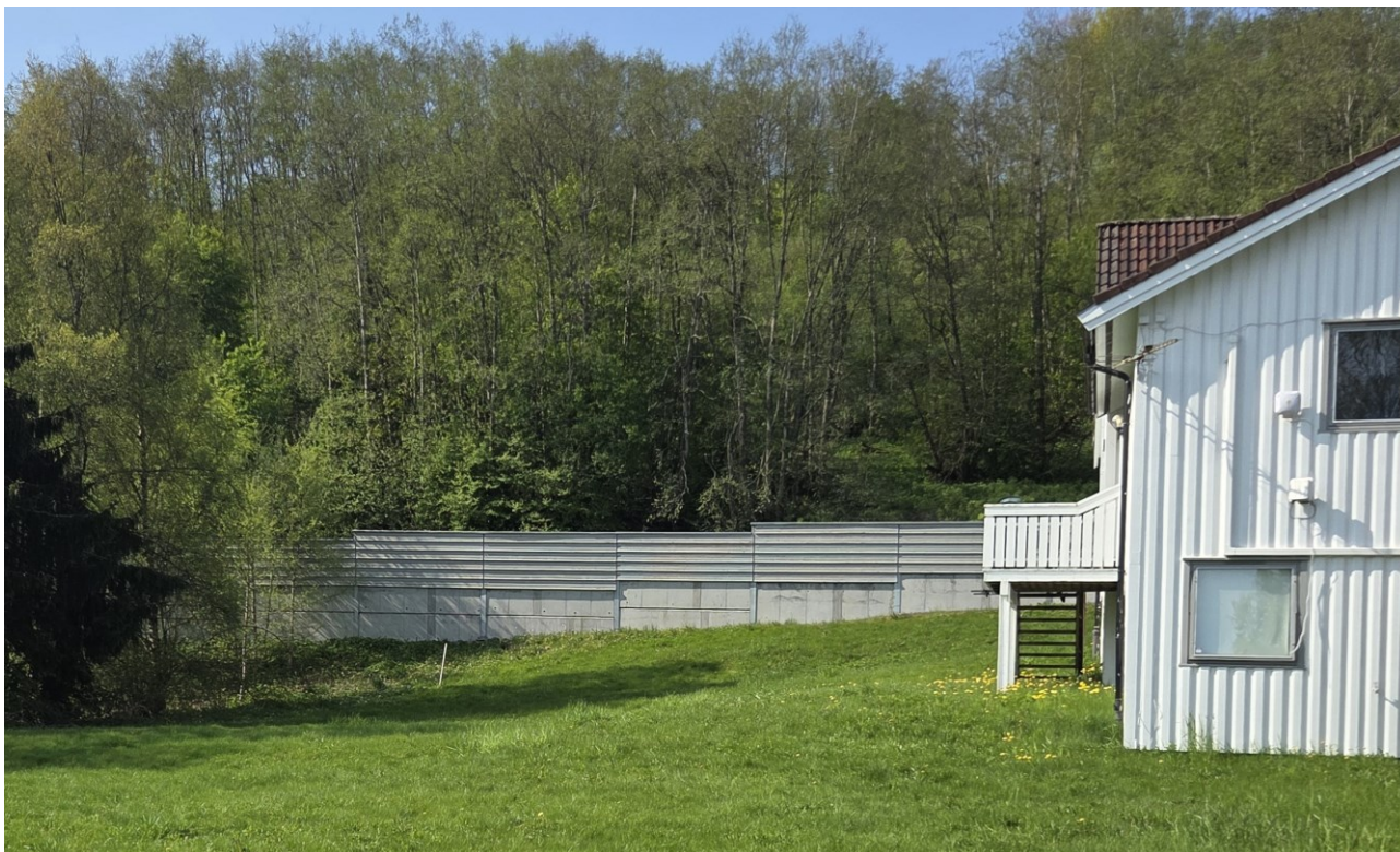
Figur 10: Støyskjerm mot Rv. 706 er vandringsbarriere for landlevende dyr som beveger seg langs bakken. Ingen åpninger i underkant av betongkonstruksjonen.