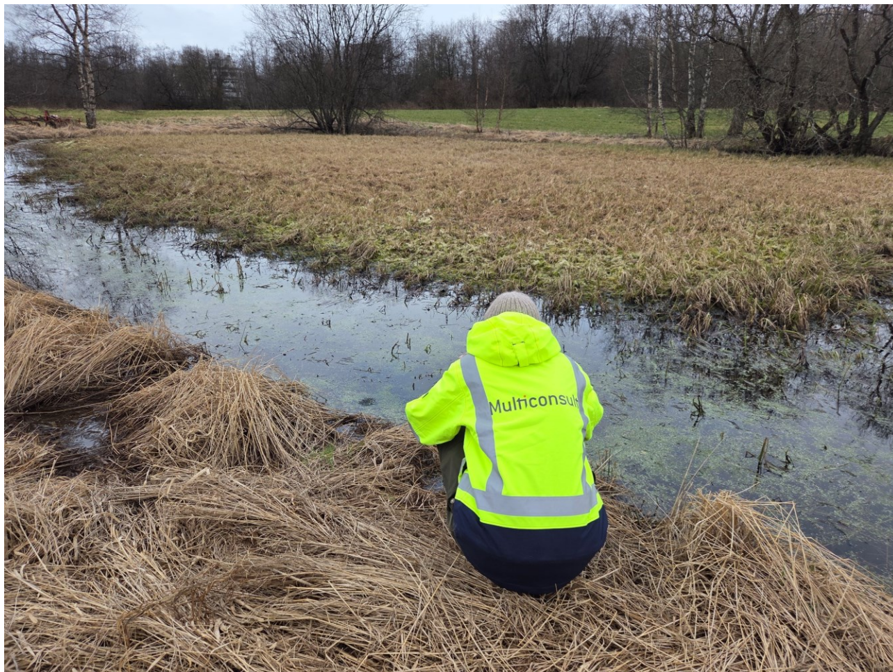
Figur 3: Isdammen gror igjen.

Isdammen ble en gang gravd ut for å kunne produsere is, som kjøleelementer og til isbiter, før elektriske kjøleskap og fryserer kom i bruk. I dag er dammen svært gjengrodd i midten, av graminider (gras og lignende), sneller og torvmoser. Det er bare i utkanten av dammen at det fremdeles er åpent vann (figur 3).