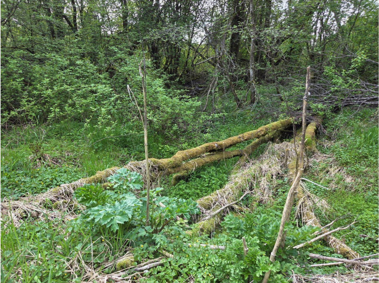
Figur 8: Potensiale for overvintringsplasser for amfibier. Kjempebjørnekjeks.

Vest for Rv. 706, like sør for den eneste rundkjøringen i reguleringsområdet, finnes også et fuktig areal med sumpvegetasjon. Det er ingen dam, men den høye vannstanden og tilsynelatende vedvarende fuktighet, gjør likevel at dette minner om yngleområder for buttsnutefrosk (figur 9). Det er ikke utenkelig at frosk kan formere seg her, men de vil i alle tilfeller ha nytte av slike områder.