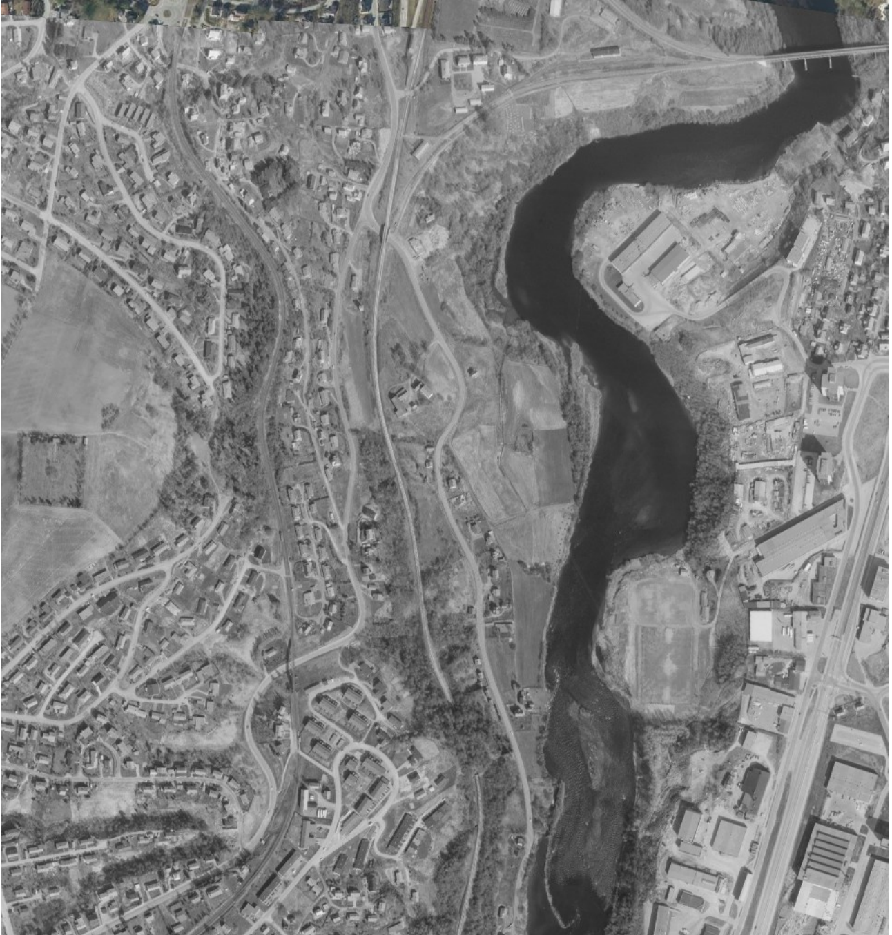
Figur: Flyfoto fra 1982. Området framstår nå fullt nedbygd og ligner dagens situasjon, men støyskjerm mot boligfeltet mangler og vandring er derfor lettere for amfibier. Dorthealyst står tilbake som rest av jordbrukslandskapet.