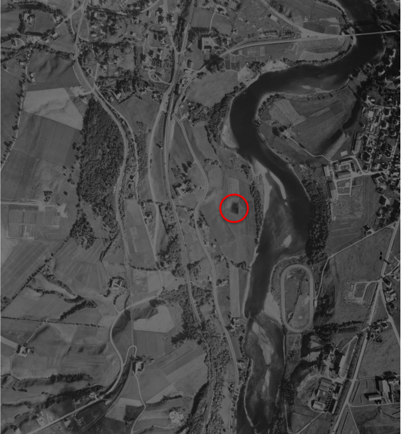
Figur 12: Flyfoto fra 1947. Isdammen i rød ring. Svært lite bebyggelse. Mer intakte vassdrag ned mot Nidelva. Isdammen er ennå intakt. Færre vandringshindre og -barrierer.