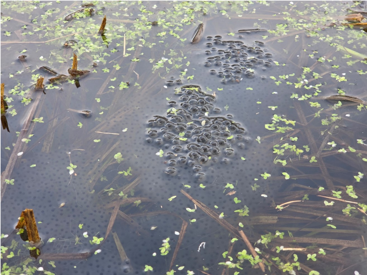
Figur 5: Eggklaser av buttsnutefrosk.

Under utsetting og innsamling av salamanderfeller, har det også blitt registrert andre arter (tabell 1). Disse er ikke i fokus for denne rapporten, men er et tilskudd til det generelle kunnskapsgrunnlaget om naturmangfold og vannmiljø, og sier noe om Isdammens funksjoner for andre arter enn salamandere.