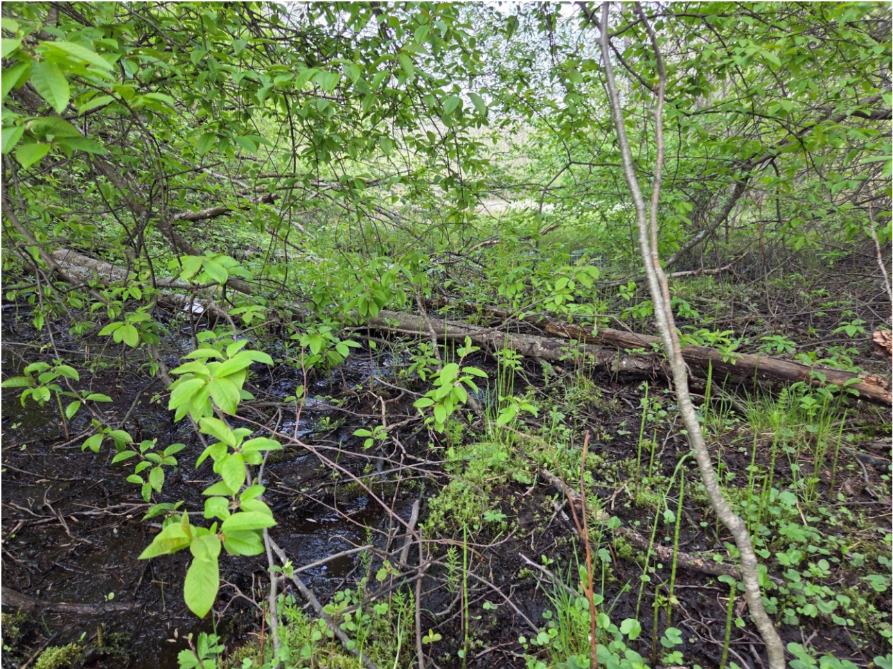
Figur 6: Fuktig skog med skjul og jaktområder for amfibier.