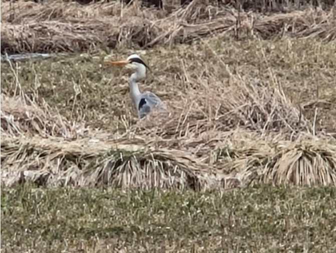
Figur 11: Gråhegre fotografert ved Isdammen ved befarig 07.04.2025

Salamandere er utsatt for predasjon fra både fisk, fugl og pattedyr. Vanlige arter som grevling, rødrev og gråhegre (figur 11) kan forsyne seg godt av en bestand. En liten og isolert bestand er mer utsatt i så måte. Vi vurderer dette som en mulig medvirkende årsak til at salamanderbestanden kan ha tapt seg.