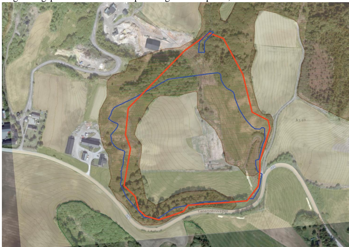
Figur 1 (Kommunens illustrasjon) Viser hvordan foreslått formål for massedeponi og fangdam (blå) avviker fra vedtatt kommunedelplan (rød) og kommer i konflikt med sone for ravinedal (brun skravur). Flyfoto viser hvor vegetasjonen allerede mangler, mot vest og mot øst.

Det foreslåtte massedeponiet ligger plassert på Tanem mellom fv. 921 og Nidelva. Reguleringsplanen omfatter et deponeringsområde på 75,5 daa.