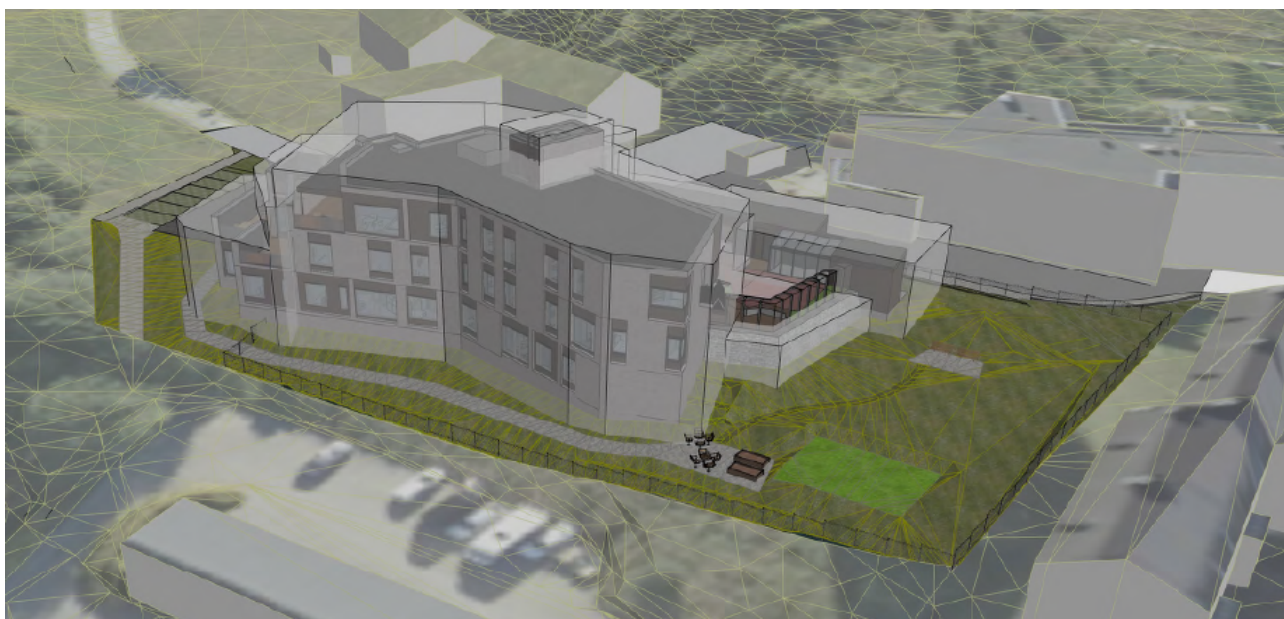
Reguleringskonvolutten, sett fra nordvest, uten endringer i fasade etter høring. (Bergersen arkitekter)