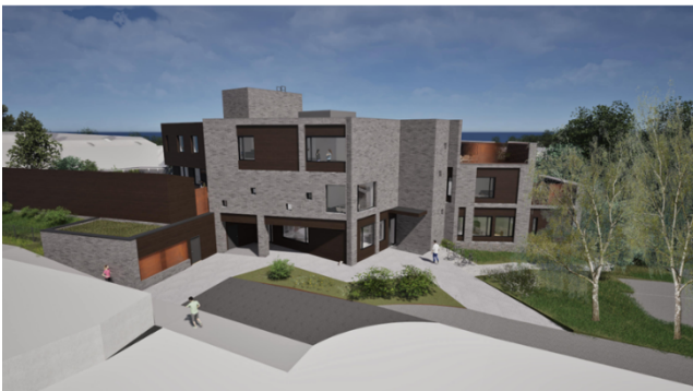
Illustrasjon inngang sørøst i høringsforslag