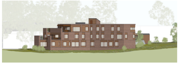
Illustrasjon fasade nordvest sluttbehandling