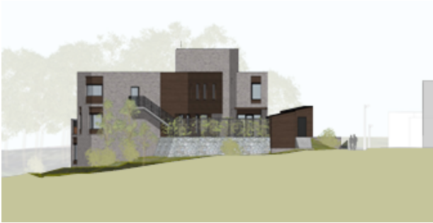
Illustrasjon fasade sørvest i høringsforslag