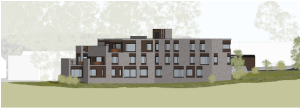
Illustrasjon fasade nordvest i høringsforslag