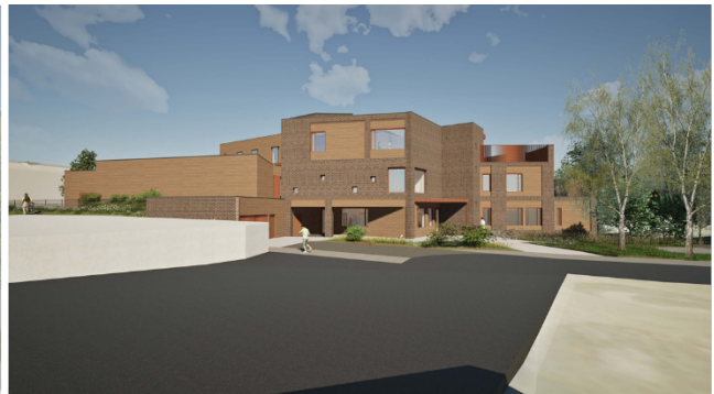
Illustrasjon inngang sørøst til sluttbehandling

Alle illustrasjoner av Bergersen arkitekter