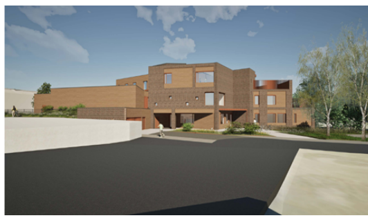
Illustrasjon inngang sørøst i høringsforslag Illustrasjon inngang sørøst til sluttbehandling

Over er illustrasjoner som viser omtalte endringer. (Over: alle illustrasjoner av Bergersen arkitekter)