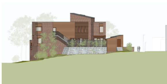
Illustrasjon fasade sørvest i høringsforslag Illustrasjon fasade sørvest til sluttbehandling