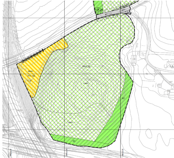
Alternativ 2a – også støyutsatt areal foreslås til klatrepark