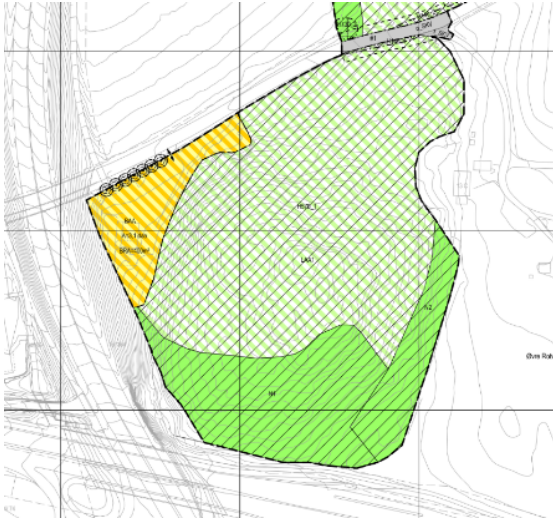
Utsnitt opprinnelig plankart (alternativ 1)