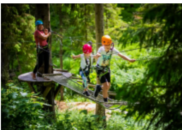
Bildene viser planområdet på Rotvoll, og en typisk klatreløype.