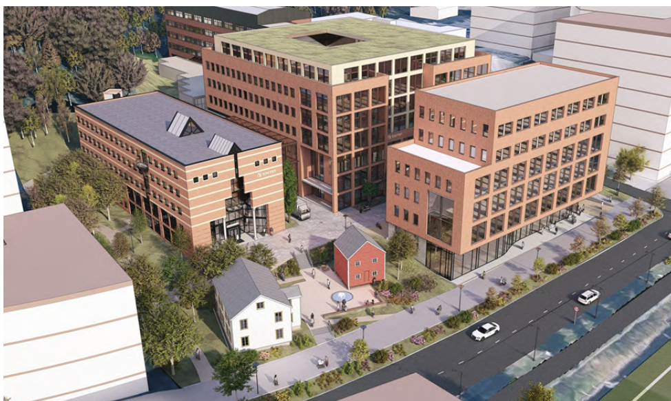
Figur 4: 3D-illustrasjon av full utbygging, samt utvidelse av fortau og ny plassering av Lund gård i tråd med områdeplanen. Hvite volum på siden av planområdet er fra områdeplanen.

Rekkefølgekrav om flytting av Lund gård er knyttet til etablering av ny bebyggelse innenfor felt K/T1 (nytt hallbygg). Oppgradering av parkareal (PA) og parkering og grøntområde (K/T1 og TO) mot S.P. Andersens veg, er knyttet til etablering av ny bebyggelse innenfor felt K/T1 og K/T3 (nytt glassbygg).