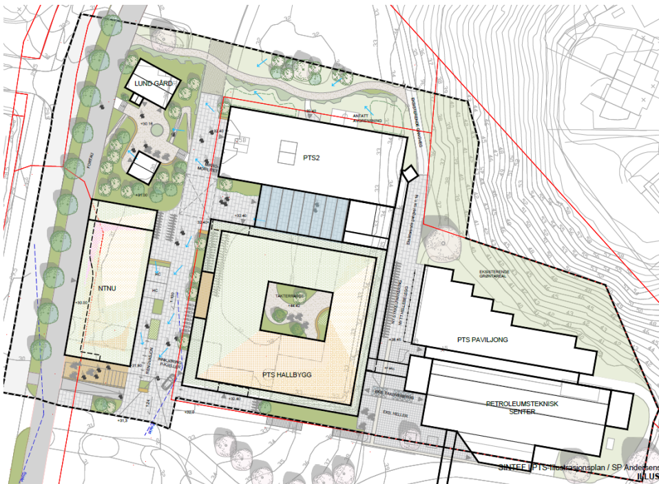
Figur 2: Illustrasjonsplan ny situasjon (full utbygging)

Planen legger til rette for utvidelse av PTS hallbygg (K/T1), et nytt glassbygg mellom eksisterende og ny bebyggelse for SINTEF (K/T3) og et nytt NTNU bygg i vest (K/T4). I tillegg legger planen til rette for flytting av Lund gård lengre inn på tomten (innenfor T2) slik at det blir plass til etablering av framtidig fortau på østsida av S. P. Andersens veg.