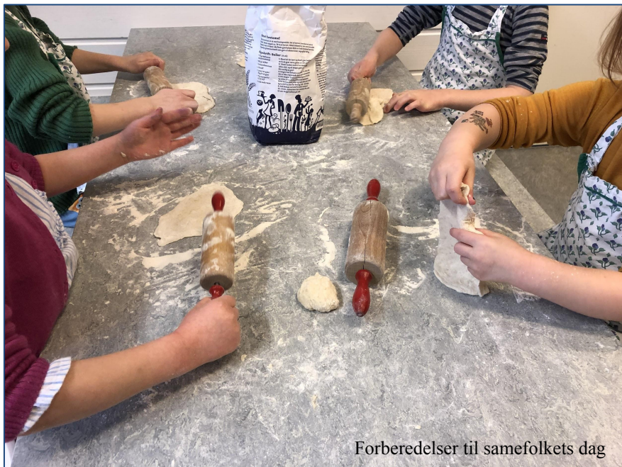
Forberedelser til samefolkets dag