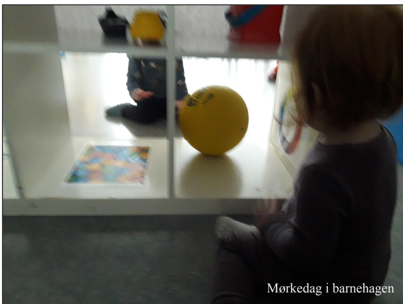
Mørkedag i barnehagen

Bærekraftig utvikling handler om at mennesker som lever i dag, får dekket sine grunnleggende behov uten å ødelegge fremtidige generasjoners mulighet for å dekke sine. Barnehagen skal bidra til at barna kan forstå at dagens handlinger har konsekvenser for fremtiden.