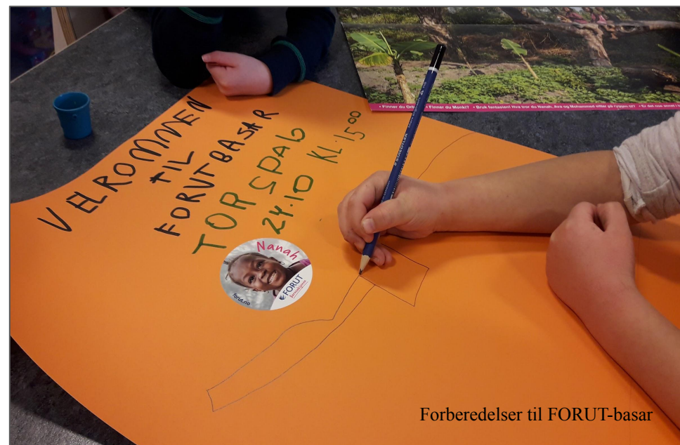
Forberedelser til FORUT-basar