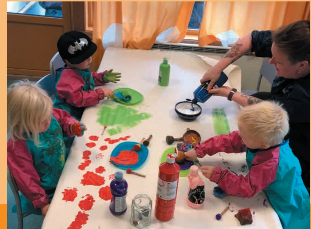
Sammen danner vi gode relasjoner og sterke fellesskap