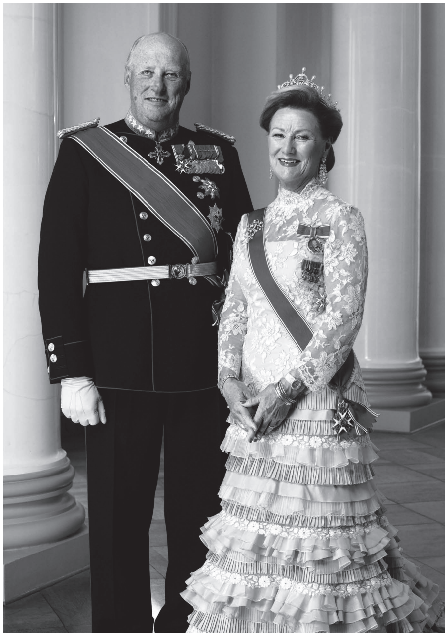
DD.MM. Kong Harald og Dronning Sonja