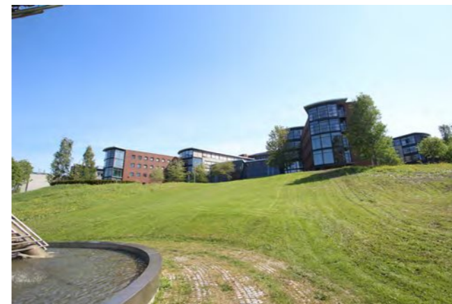
Lade allé 70