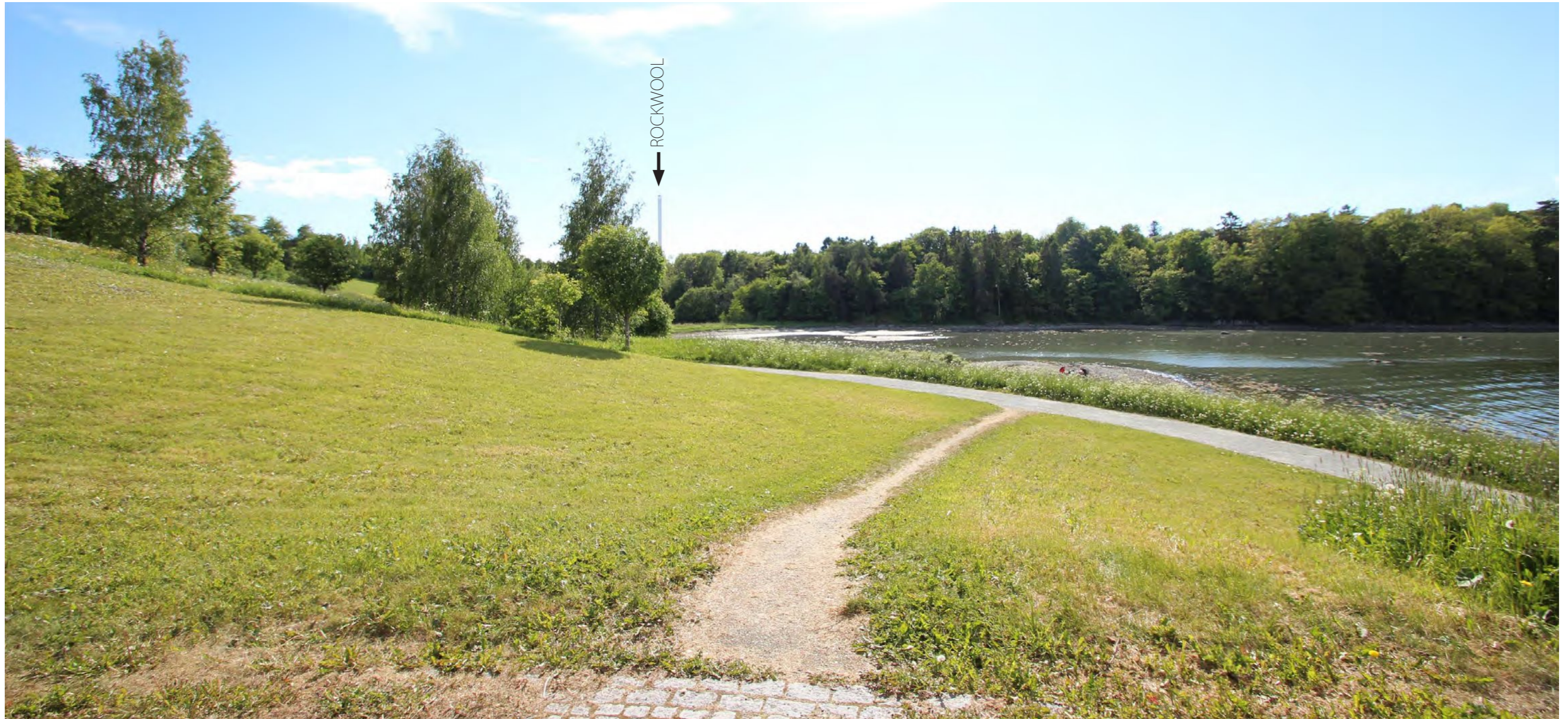
Bebyggelse sett fra standpunkt: