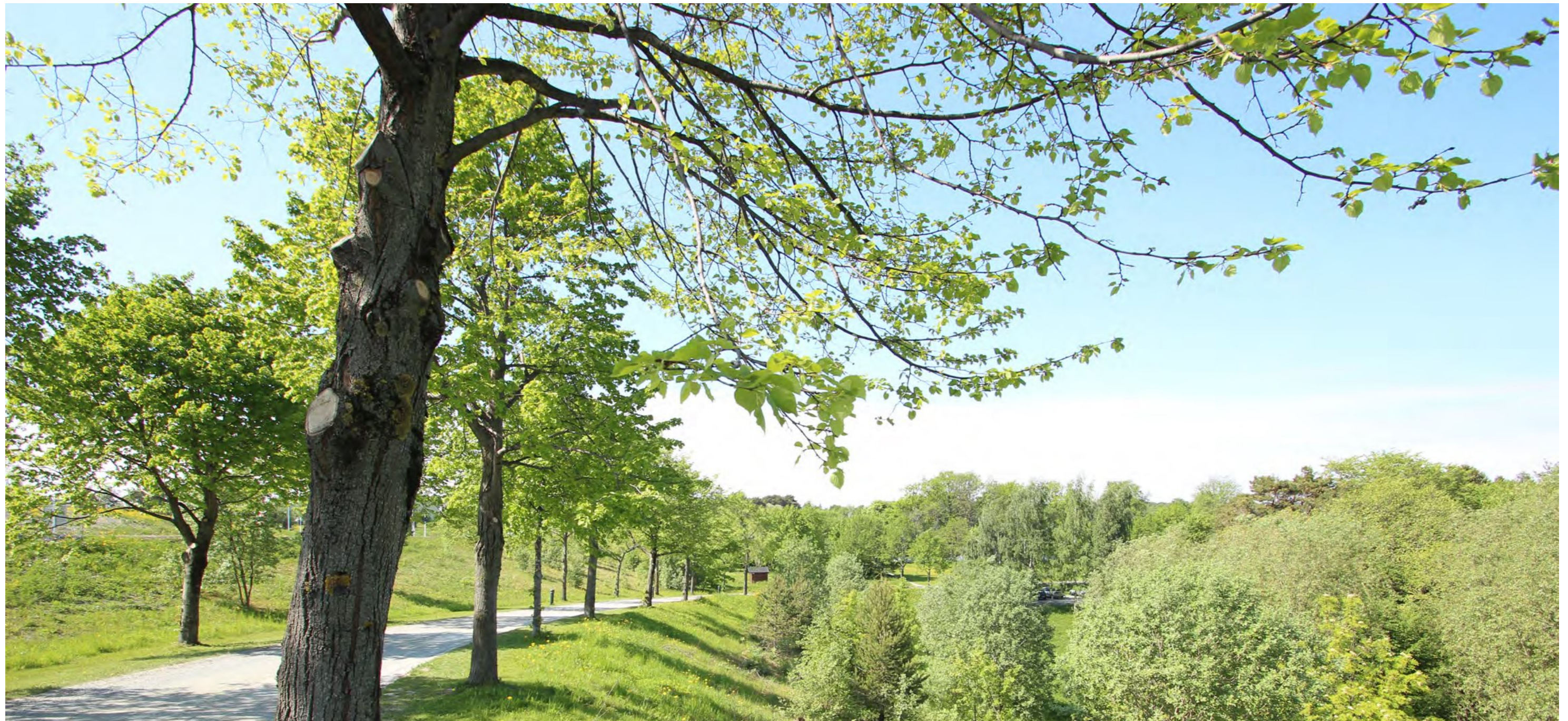
Statoil sett fra alléen