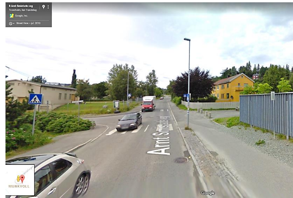
Figur 2: Arnt Smistads veg mot nordvest.