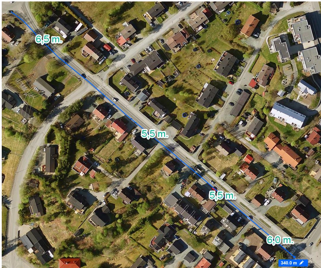
Figur 3: Oversiktsbilde Arnt Smistads veg. Lengden på vegstrekningen er ca. 350 meter. Vegbredden varierer fra 5,5 meter til 6,5 meter.

Busser måler omlag 3,25 meter i bredde. Der vegen er for smal vil vegen utvides slik at det ikke vil være noe problem når bussene møtes. Dette gjøres primært ved å flytte kantstein, og ingen hager vil berøres.