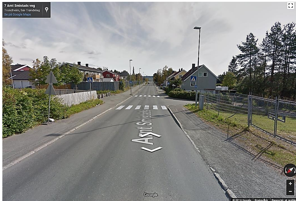
Figur 1: Arnt Smistads veg mot sørøst.

Figur 2 viser et utsnitt av vegen mot nordvest.