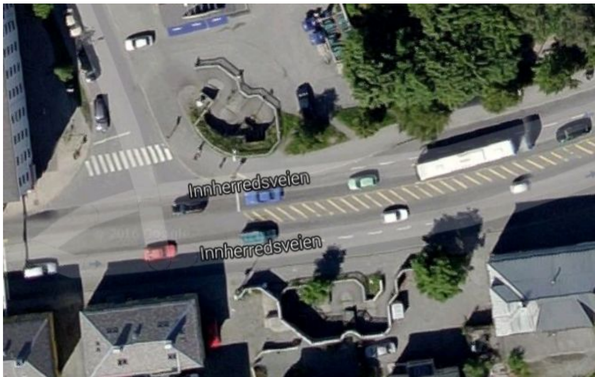
Figur 8: Krysset med Thomas von Wesens gate

Det er busstopp begge veger mellom kryssene Rønningsbakken/Gamle Kongevei – Innherredsveien – Thomas v Westens gt.