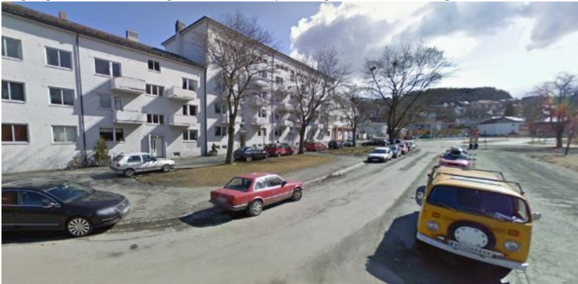
Figur 18: Parkering i Anders Buens gate

Langs og ved Anders Buens gate er det en del parkering både av beboere og besøkende.