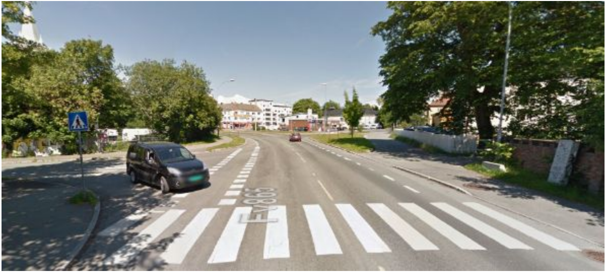
Figur 19: Planområdet slutt i Stadsingeniør Dahls gate