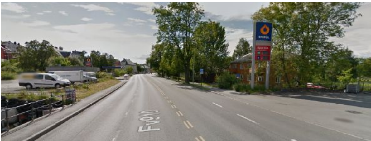
Figur 4: Innherredsveien v/nr 108B

Gang- og sykkelvegen på nordsiden av Innherredsveien starter ved Persaunevegen og passerer Statoilstasjonen i en begrenset bredde, som fortau, før den igjen går over til normal bredde fram til Thomas von Westens gate.