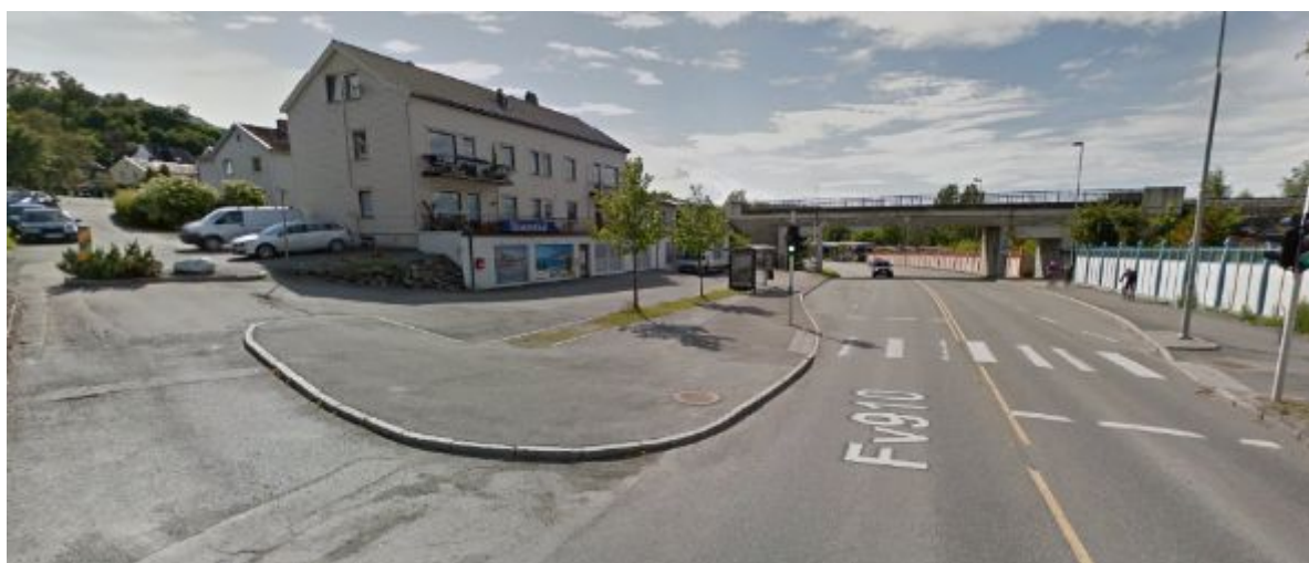
Figur 2: Innherredsveien v/Saxenborg allé

Planområdet starter ved Saxenborg allé. Her er det av- og påkjøring for å betjene næringsdelen i 1.etg. på nærmeste eiendom. Ut over dette er det kun gang og sykkelforbindelse med Innherredsveien her.