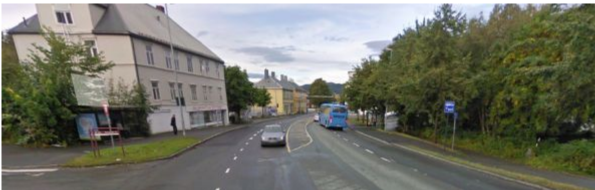
Figur 7: Innherredsveien 91

Rønningsbakken og Gamle Kongeveg knyttes sammen i kryssområdet med Innherredsveien. Krysset er kun regulert med vikeplikt. Rønningsbakken-Gamle kongeveg er del av hovedsykkelruta i Trondheim.