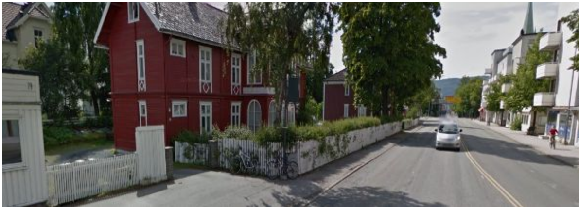
Figur 13: Avkjørsel mellom Innherredsveien 77 og 79