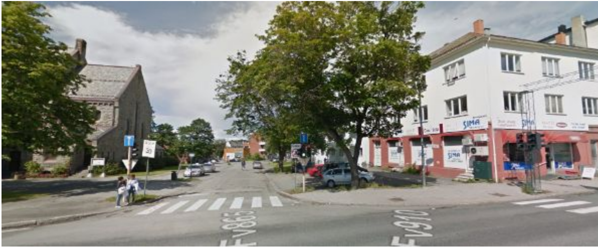
Figur 17: Anders Buens gate

Mot nord starter Anders Buens gate. Den munner ut i Thomas von Westens gate og er stengt midtveis for gjennomkjøring. Krysset med Innherredsveien betjener blant annet atkomst til Lademoen kirke, Den Nyapostoliske kirke, Nærbutikken Sima, Voldsminde barnehage, Logopedisk senter, et par konsulentbedrifter og tilliggende boliger.