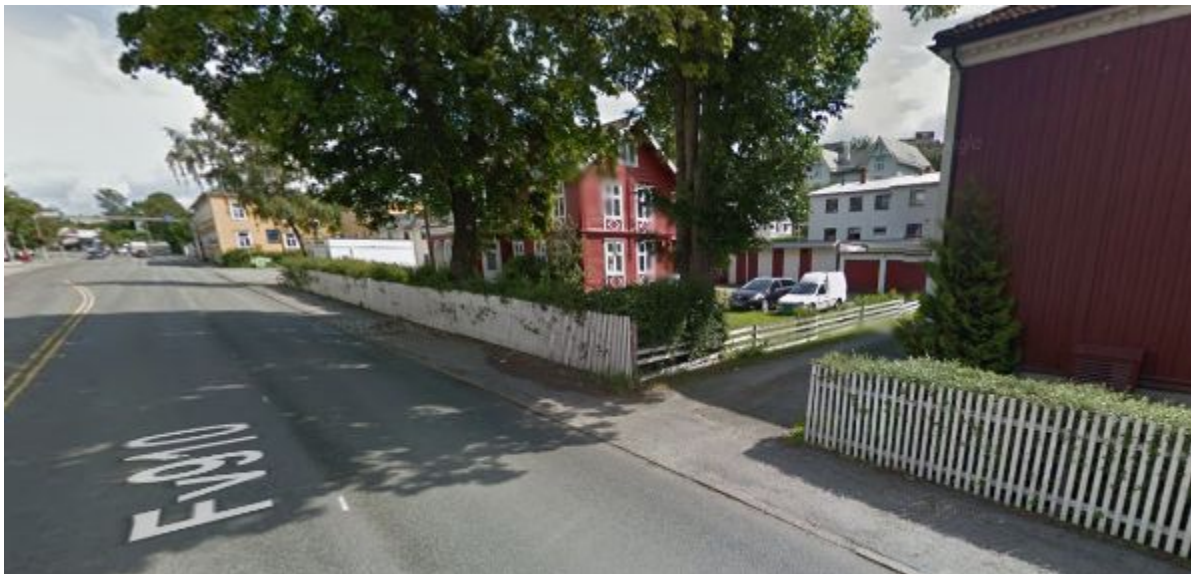
Figur 14: Avkjørsel mellom Innherredsveien 75 og 77

For enden av Innherredsveien 75 er det søppelkopper som nødvendiggjør stopp for renholdsverket i Innherredsveien.