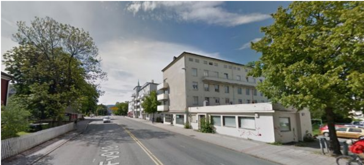
Figur 10: Innherredsveien mellom Thomas von Westens gate og Anders Buens gate

Figuren over viser for eiendommer på strekningen Tomas von Westens gate til Stadsingeniør Dahls gate