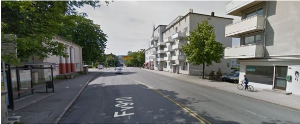
Figur 15: Busstopp ved Innherredsveien 73 (Rosendal kino).

Dagens kryss med Stadsingeniør Dahls gate-Innherredsveien – Anders Buens gate er lysregulert og svært arealkrevende. Gang og sykkelveg, samt sykkelfelt i kjørebane, flere kjørefelt og rabatter gjør krysset svært arealkrevende. Utformingen påvirkes også av retningen Stadsingeniør Dahls gate kommer inn mot Innherredsveien på.