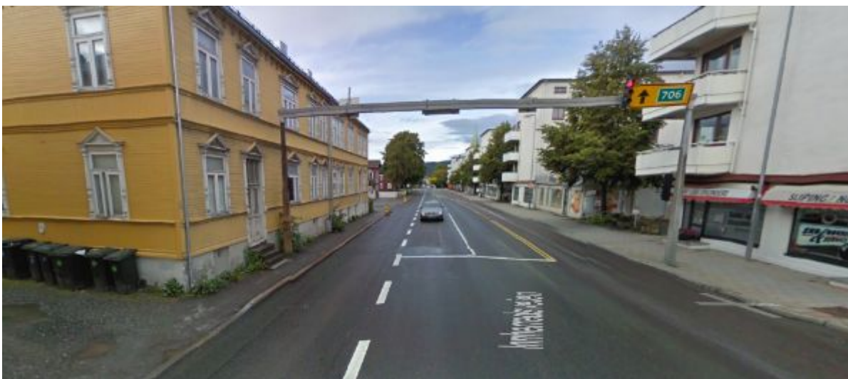
Figur 11: Innherredsveien 83A og 85A

Langs Innherredsveiens nordside, mellom Thomas von Westens gate og Anders Buens gate (nr 92A-80) er det ingen direkte avkjørsler ut i Innherredsveien. All atkomst til disse eiendommene skjer via Anders Buens gate. Bebyggelsen har gjennomgående næringsaktivitet i første etasje og leiligheter i etasjene over. Det stikker ut trapper og lysgraver ut i fortauet på hele denne strekningen.