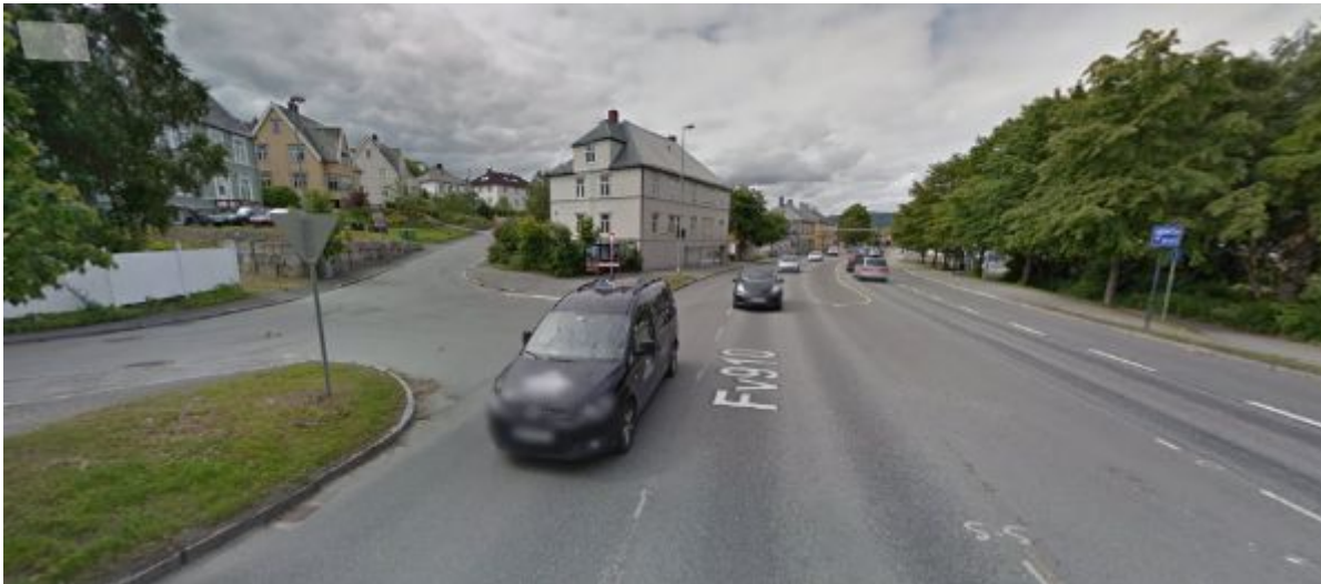
Figur 6: Rønningsbakken/Gamle Kongevei

Rønningsbakken og Gamle Kongeveg knyttes sammen i kryssområdet med Innherredsveien. Krysset er kun regulert med vikeplikt. Rønningsbakken-Gamle kongeveg er del av hovedsykkelruta i Trondheim.