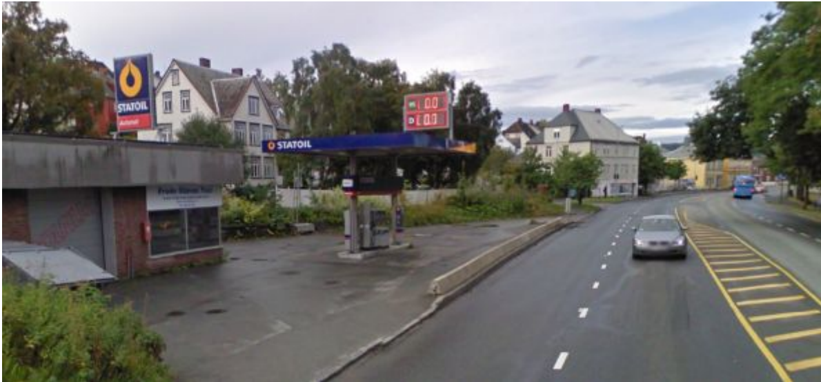
Figur 5: Innherredsveien 101