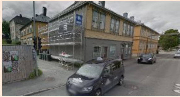
Figur 12: Direkteavkjørsel ved Innherredsveien 87, 85 og 83