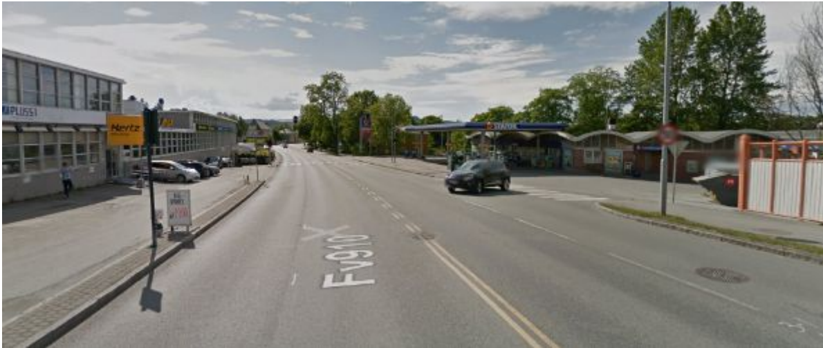
Figur 3: Innherredsveien v/Thomas Hirsch gate

På sørsiden (til venstre), Innherredsveien 103 er det næringsbygg med flere næringer. Til denne eiendommen er det «høyre av» - avkjørsel fra Innherredsveien og «høyre på» ut på Innherredsveien. På sørsiden er det ikke fortau. Det pågår det planarbeid på Innherredsveien 103, som har til hensikt å etablere boligbebyggelse på tomte.