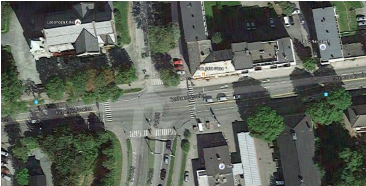
Figur 16: Krysset med Stadsingeniør Dahls gate og Anders Buens gate

Dagens kryss med Stadsingeniør Dahls gate-Innherredsveien – Anders Buens gate er lysregulert og svært arealkrevende. Gang og sykkelveg, samt sykkelfelt i kjørebane, flere kjørefelt og rabatter gjør krysset svært arealkrevende. Utformingen påvirkes også av retningen Stadsingeniør Dahls gate kommer inn mot Innherredsveien på.