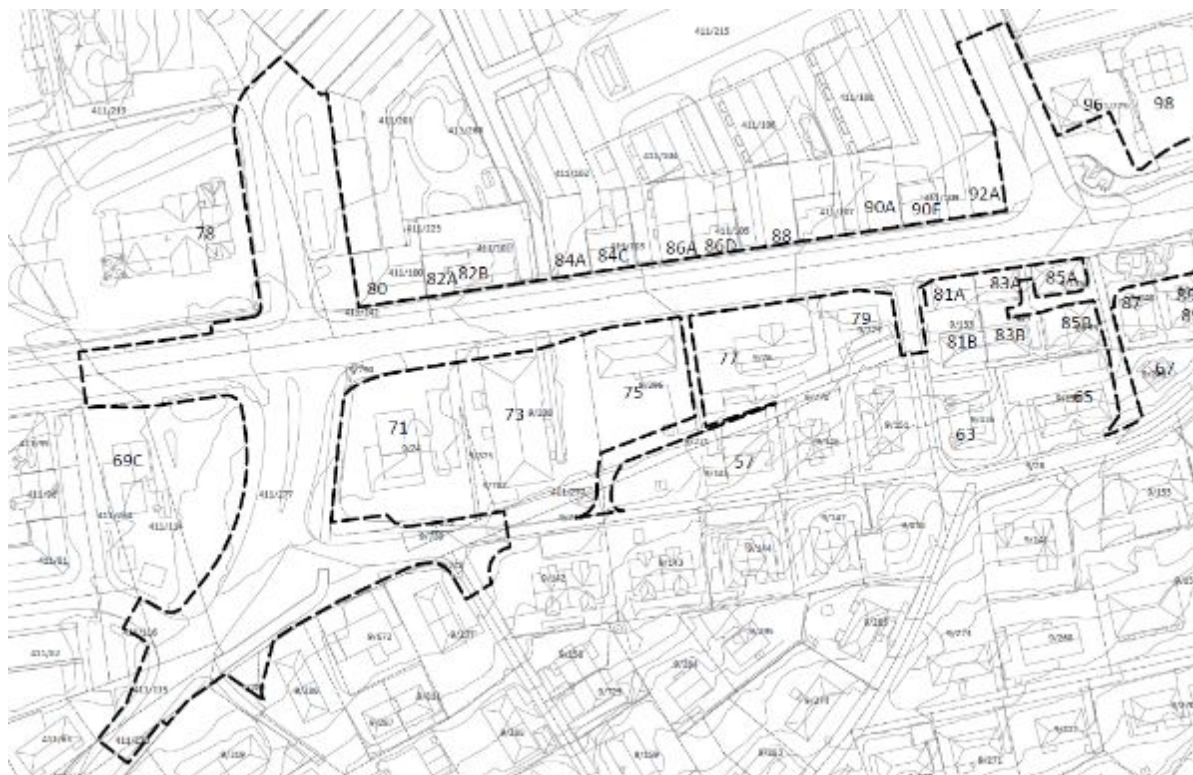
Figur 9: Innherredsveien med gatenummer –

I det lysregulerte krysset Innherredsveien - Thomas von Westens gate er den eneste fotgjengerundergangen i planområdet. Disse har en utforming som trolig tilfredsstiller kravene til universell utforming, men framstår som plasskrevende og uoversiktlige.