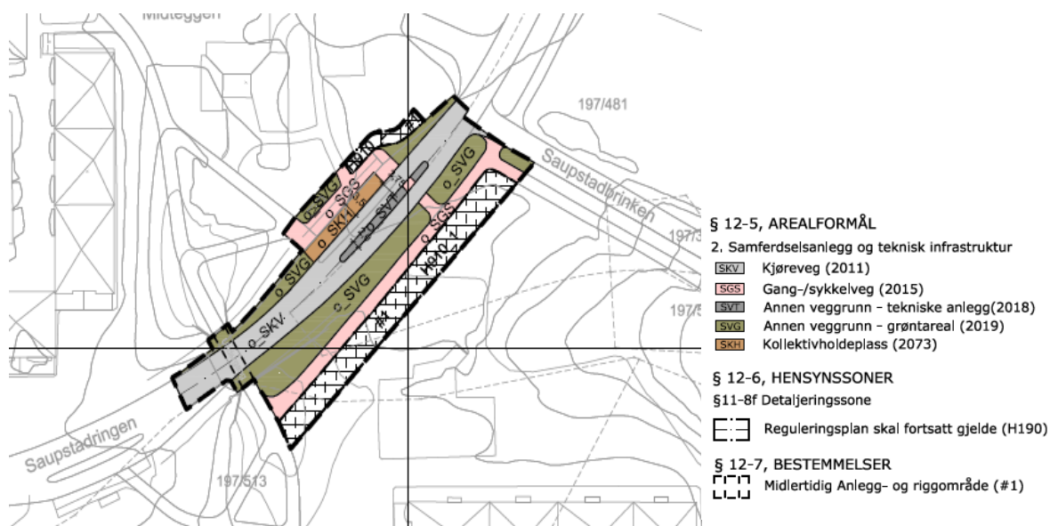
Illustrasjon av plankartet, nedfotografert.

Planforslaget legger til rette for etablering av en kantstopp holdeplass med en plattform på 25 meters lengde og 3,5 meters bredde i Saupstadringsen. Holdeplassen vil ha tilnærmet lik beliggenhet som dagens holdeplass, men dagens busslomme erstattes av plattform, kjørebane, leskur, grøntarealer og gangveg. Det tilrettelegges for sykkelparkering for seks sykler, som skal plasseres i møbleringssonen på holdeplassen.