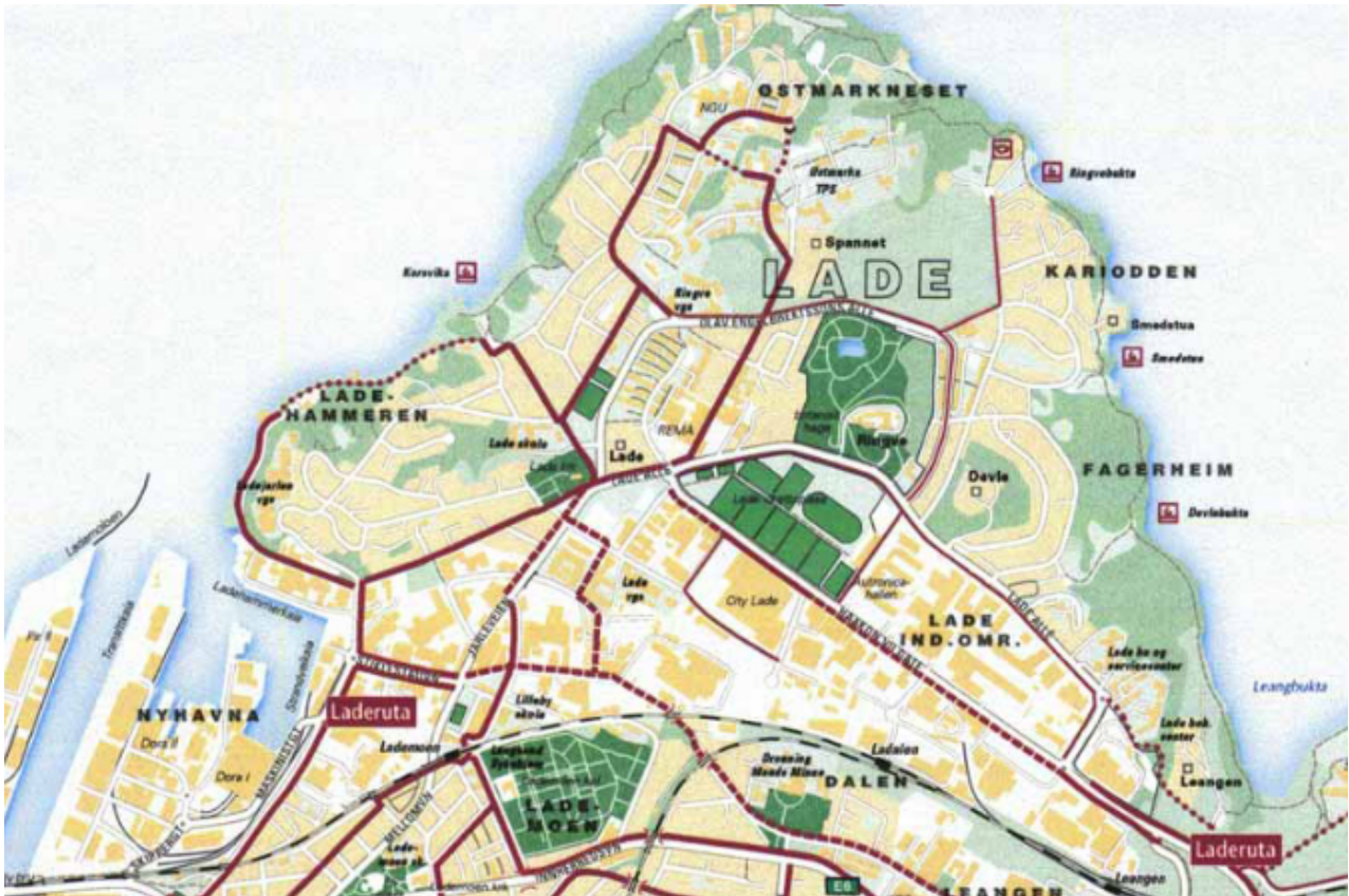
Figur 5 – Sykkelrutekart Trondheim

Østmarka ligger nær gang og sykkelvegnett og har et godt utgangspunkt for å øke gang- og sykkeltrafikken i nærområdene.