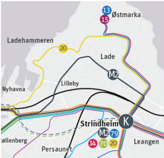
Figur 4 – Fremtidig rutestruktur på Lade