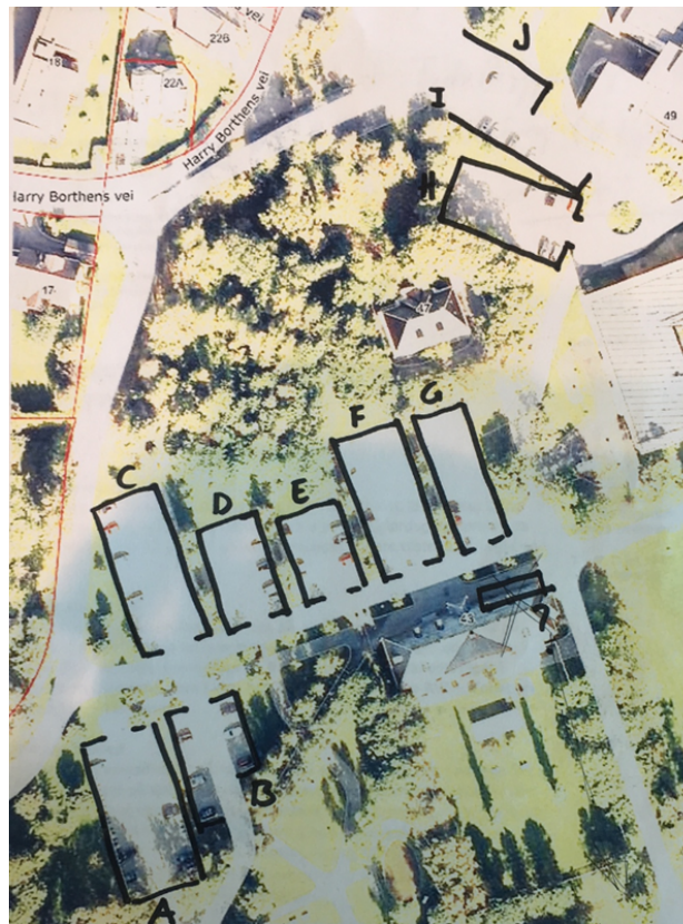
Tabell 1 – Kartlegging av dagens parkeringssituasjon.

Kartleggingen viser noe flere parkeringsplasser enn hva sykehuset oppgir. Det kan ha sammenheng med at deler av parkeringsarealet tidvis har vært benyttet til andre formål som riggområde etc.