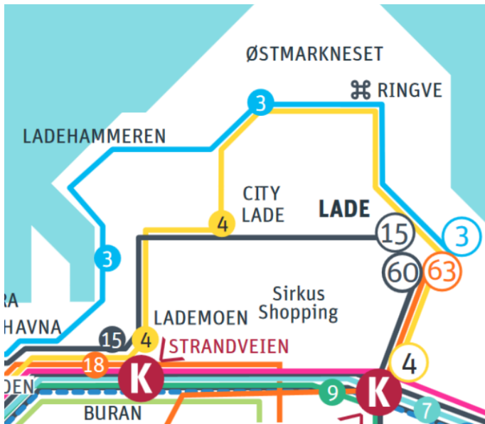
Figur 3 – Stilisert linjekart for Lade, dagens situasjon