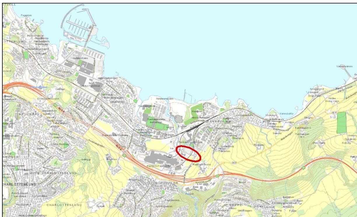
Figur 1 – oversiktskart