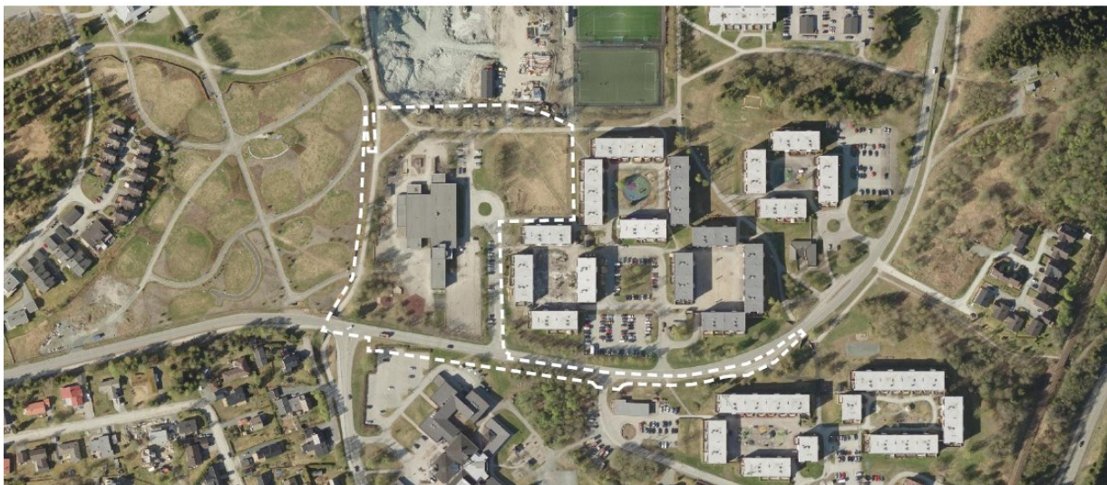
Planområdet markert med hvit stipling. Flyfoto fra 2016.

Hensikten med planen er å legge til rette for bygging av ny barneskole og ungdomsskole på tomte som i dag rommer Saupstad barneskole. Huseby ungdomsskole er revet, og på den tomte bygger Sør-Trøndelag fylkeskommune ny Heimdal videregående skole. Den nye ungdomsskolen er planlagt for 450 elever, og den nye barneskolen for 700 elever, totalt 1150 elever. Det planlegges også for et kulturskolesenter for skolekretsene sør i Trondheim. Kulturskolen har en målsetting om å gi et tilbud til 30 % av elevene i Trondheim, det innebærer at kulturskolesenteret kan komme til å tilby undervisning til ca 1200 elever hver uke. Planforslaget skal sikre areal til bygging av nødvendige tiltak for trafiksikker skoleveg og adkomst for skoleanleggets brukere.