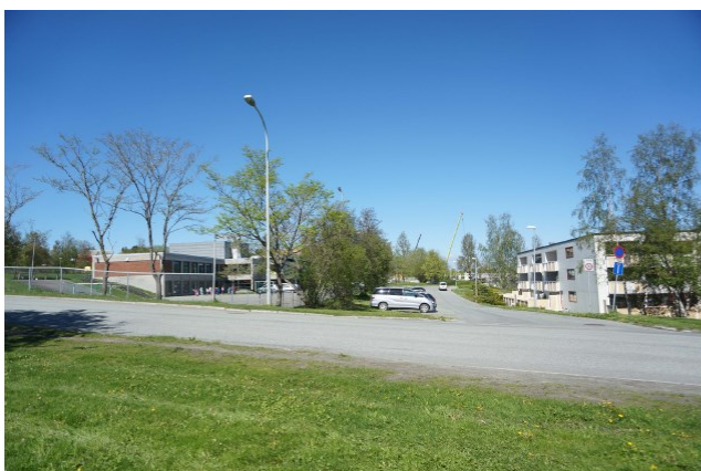
Dagens situasjon (mai 2017)

Planen legger til rette for en samlokalisering av to små eksisterende barneskoler (Saupstad og Kolstad) og en ungdomsskole (Huseby). Dette gir et større skolemiljø enn i dag, og er vurdert å være positivt for den sosiale infrastrukturen i området. Utbygging av en ny skole vil også bidra positivt til lokal stedsutvikling. Skolen ligger i den eksisterende «skoleaksen» som er et plangrep fra 1974-planen. Uteområdene til fremtidig skole vil oppgraderes sammenlignet med dagens situasjon, og dette vil komme nærmiljøet til gode i form av bedre arealer for lek og opphold etter skoletid. Gang- og sykkelveger i området rundt skolen vil også oppgraderes.