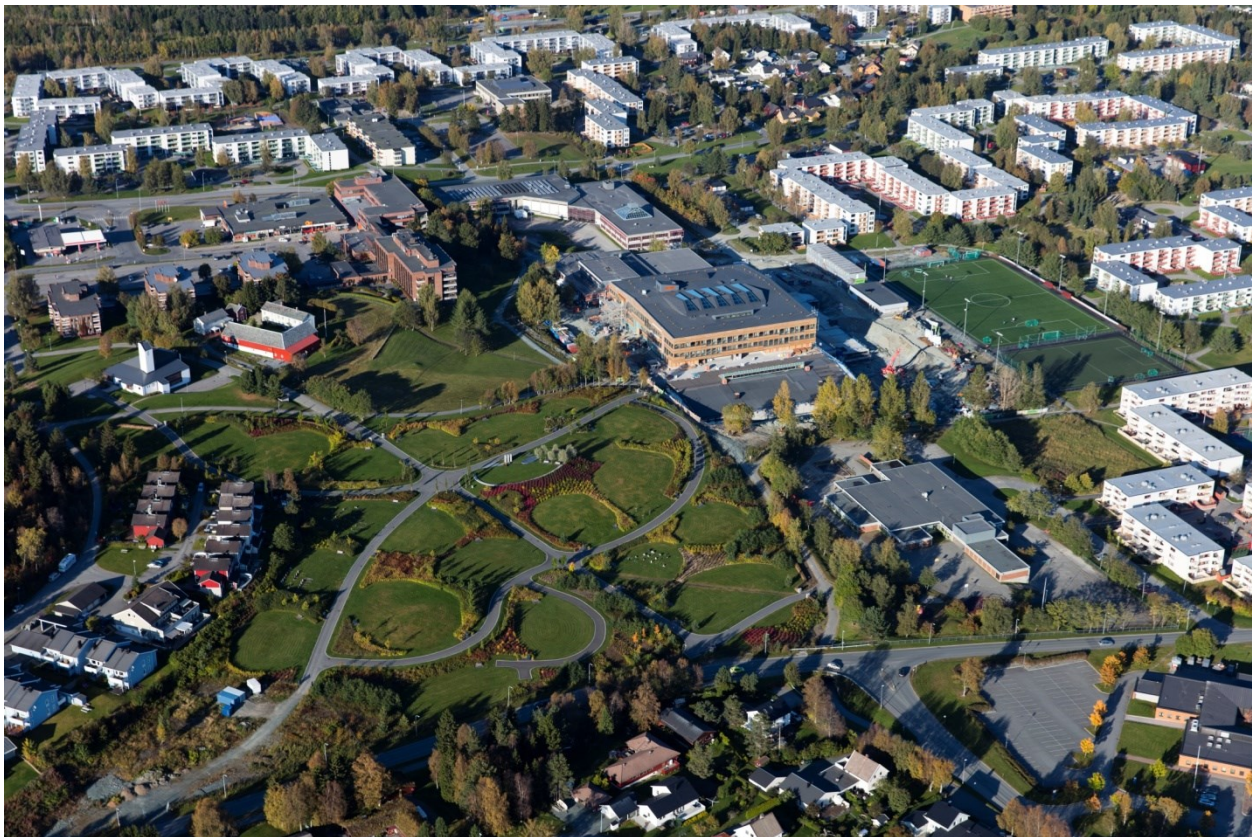
Flyfoto av området, Heimdal vgs (under bygging) midt i bildet med dagens Saupstad skole sør for denne (Skanska AS)

Planområdet ligger i Kolstad bydel, ca. 10 km sør for Trondheim. Skoletomta avgrenses av Heimdal videregående skole og offentlig grøntdrag i nord, boliger i Midteggjen borettslag i øst, Saupstadringen i sør og Saupstad gravlund i vest. Skoletomta er totalt ca. 28 daa. Planområdet er ca. 31 daa når tilliggende gang- og sykkelveier som inngår i plankartet er inkludert.