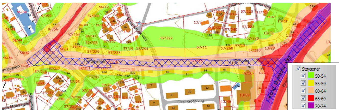
Utdrag fra kommunens støysonekart

Selve Tyholtveien har i henhold til kommunens støysonekart et støynivå på 60-64 dB. I krysset mot Kong Øysteins veg er støynivået opp mot 70-74 dB, jf. utdrag fra støysonekartet i figur under: