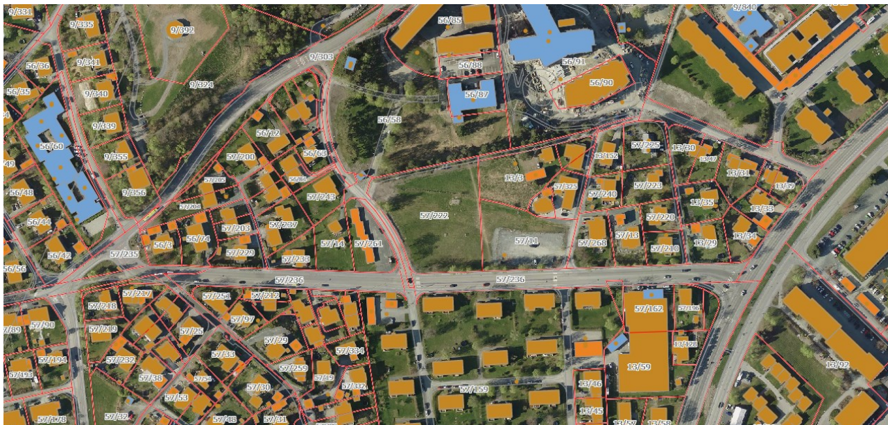
Ortofoto over planområdet