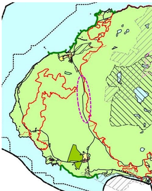
Utsnitt av KPA. Planområdet langs fylkesveien er markert med stiplet lilla linje. Rød linje er grensen til marka.

Prosjektet er en del av trafikksikkerhetsplan for Trondheim kommune 2012-2016. Prosjektet inngår også i Miljøpakkens handlingsprogram 2017-2020 og 2020-2023 som et trafikksikkerhetstiltak.