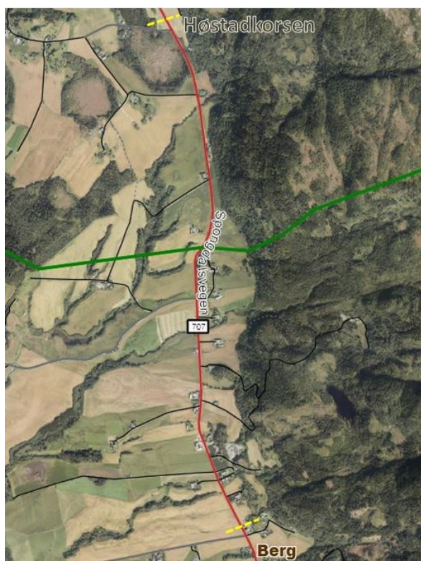
Planområdet på Byneset begynner ved Høstadkorsen i nord og går til Berg i sør, grensene er markert med gule stiplede linjer. Fylkesveien er markert med rødt og skolekretsgrense for barneskolene Rye og Spongdal er markert med grønt.

Planområdet strekker seg langs fylkesveg 707 fra Berg, 3 km nord for Spongdal, til Høstadkorsen 2 km sør for Rye. Lengde på strekningen er 3,5 km. Terrenget heller mot vest. Vest for veien er det dyrket mark, øst for veien stiger terrenget og går over i skogkledd åser opp mot Bymarka.