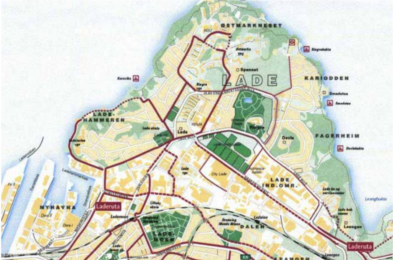
Figur 5 – Sykkelrutekart Trondheim (kilde:SVV)

Østmarka ligger nær gang og sykkelvegnett og har et godt utgangspunkt for å øke gang- og sykkeltrafikken i nærområdene.