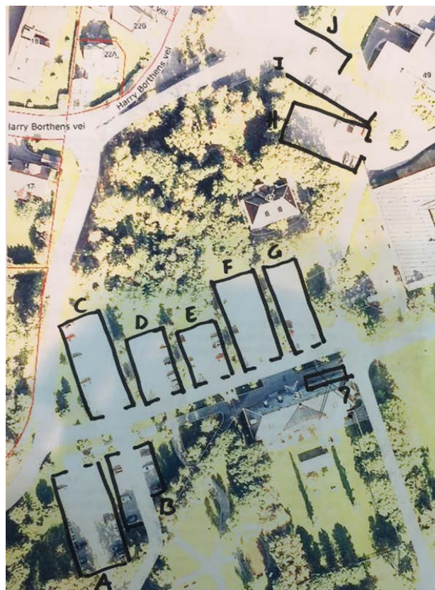
Tabell 1 – Kartlegging av dagens parkeringssituasjon.

Kartleggingen viser noe flere parkeringsplasser enn hva sykehuset oppgir. Det kan ha sammenheng med at deler av parkeringsarealet tidvis har vært benyttet til andre formål som riggområde etc.