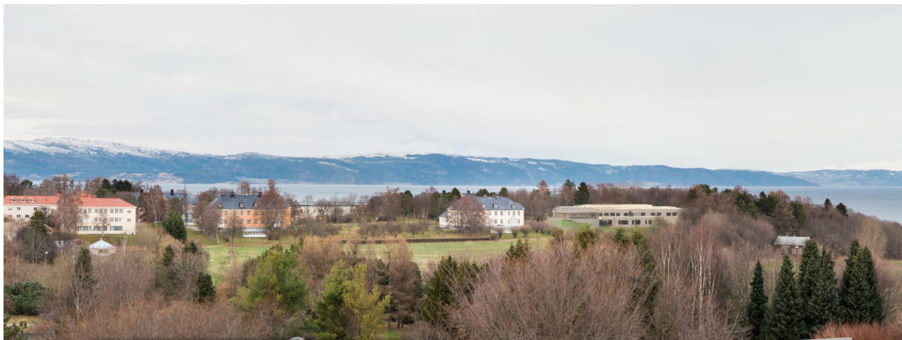
Framtidig situasjon sett fra Ringve.