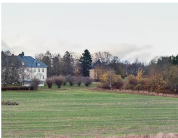
Dagens situasjon, sett fra Olav Engelbretssons allé.