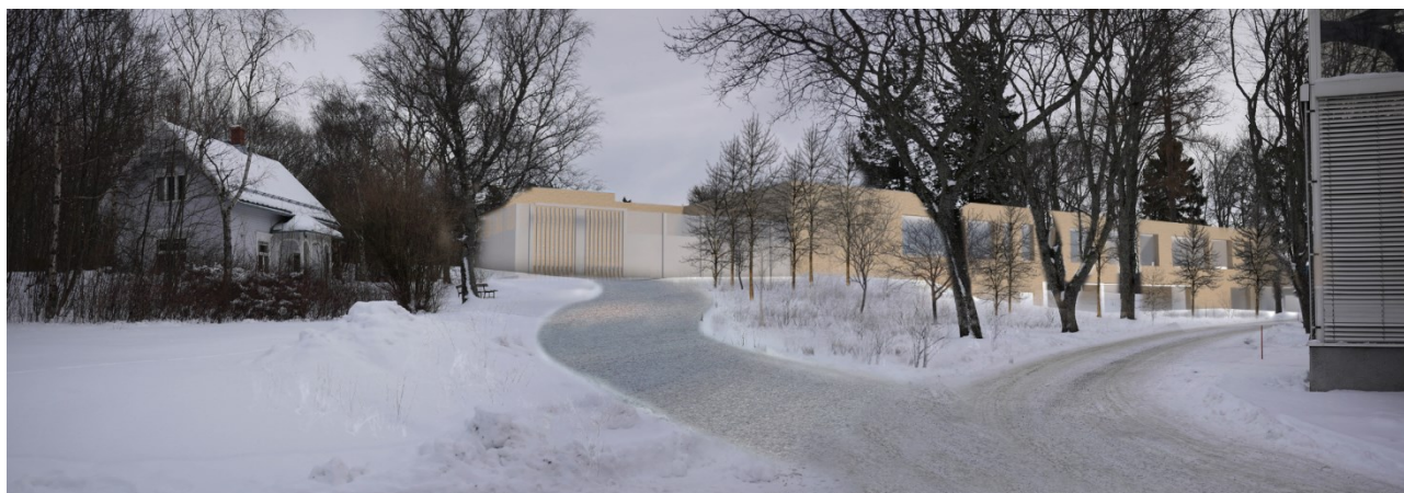
Illustrasjon av bygget sett fra nordvest.

Planforslaget regulerer en betydelig lavere utnyttelse enn gjeldende reguleringsplan (r436) åpner for. Maksimum BRA settes til 9 350 m 2 i plankartet, det er omtrent halvparten av hva gjeldende reguleringsplan tillater (med maks. BRA 16 500 m 2 ).