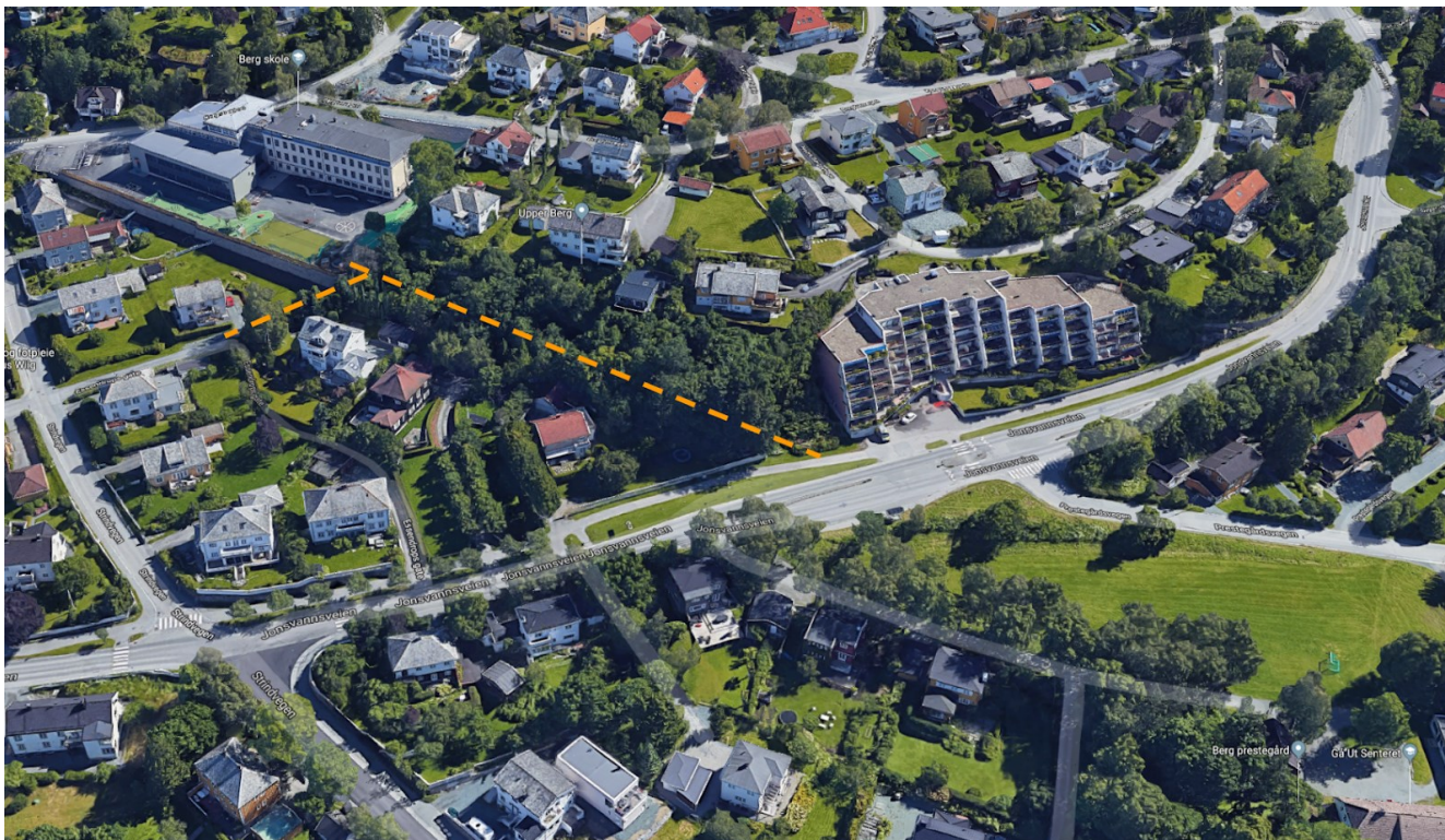
Illustrasjon som viser landskapet på Berg. Trase for planlagt snarvei gjennom grøntområdet er vist med oransje stiplet linje. På bildet vises Berg skole i øvre venstre hjørne, og Prestegårdsjordet vises nede til høyre