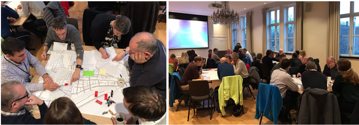
Verkstedarbeid i Storsalen på Rådhuset.

Representanter fra overordnet arbeidsgruppe (Statens vegvesen, Trøndelag fylkeskommune, Miljøpakken, Næringsforeningen i Trondheimsregionen og politiet) og representanter fra ulike enheter i Trondheim kommune deltok i de fleste verkstedene. Andre deltakere nevnes under.