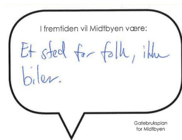
Innspill fra Kulturnatt