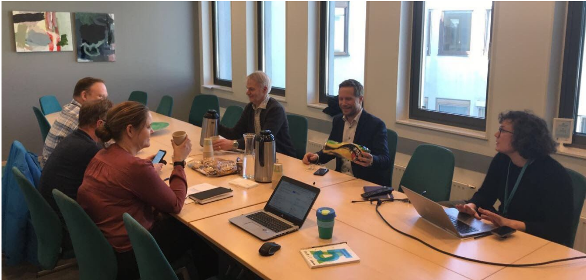
Noen av deltakerne i overordnet arbeidsgruppe feirer vedtak av kortsiktig gatebruksplan.