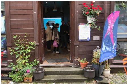
Pop-up-kontor på Kulturnatt