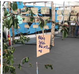
Barn i sentrum