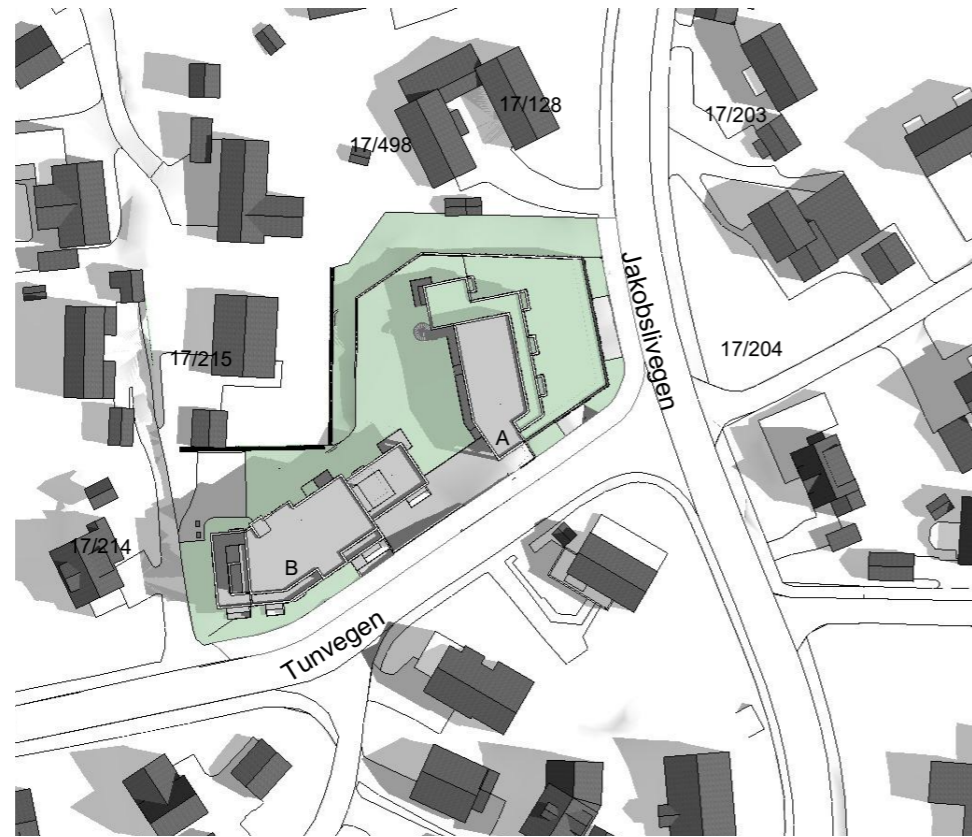
21. Juni kl 09:00