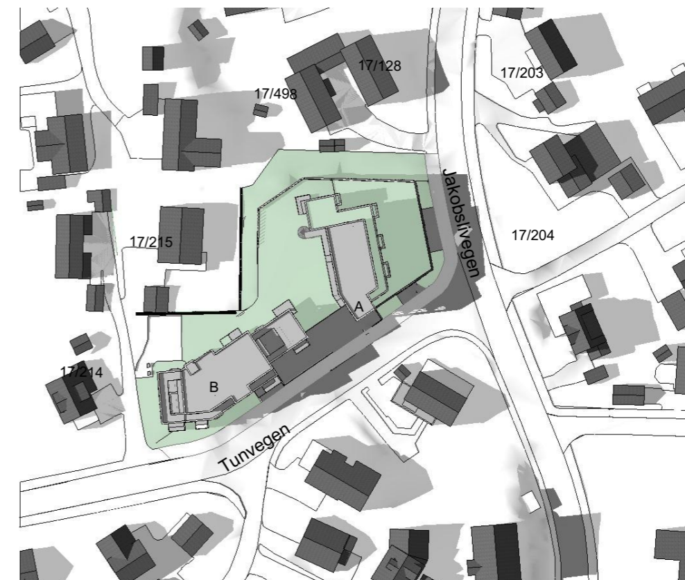
21. Juni kl 18:00

Nb. Planillustrasjon fra foreløpig skisseprosjekt