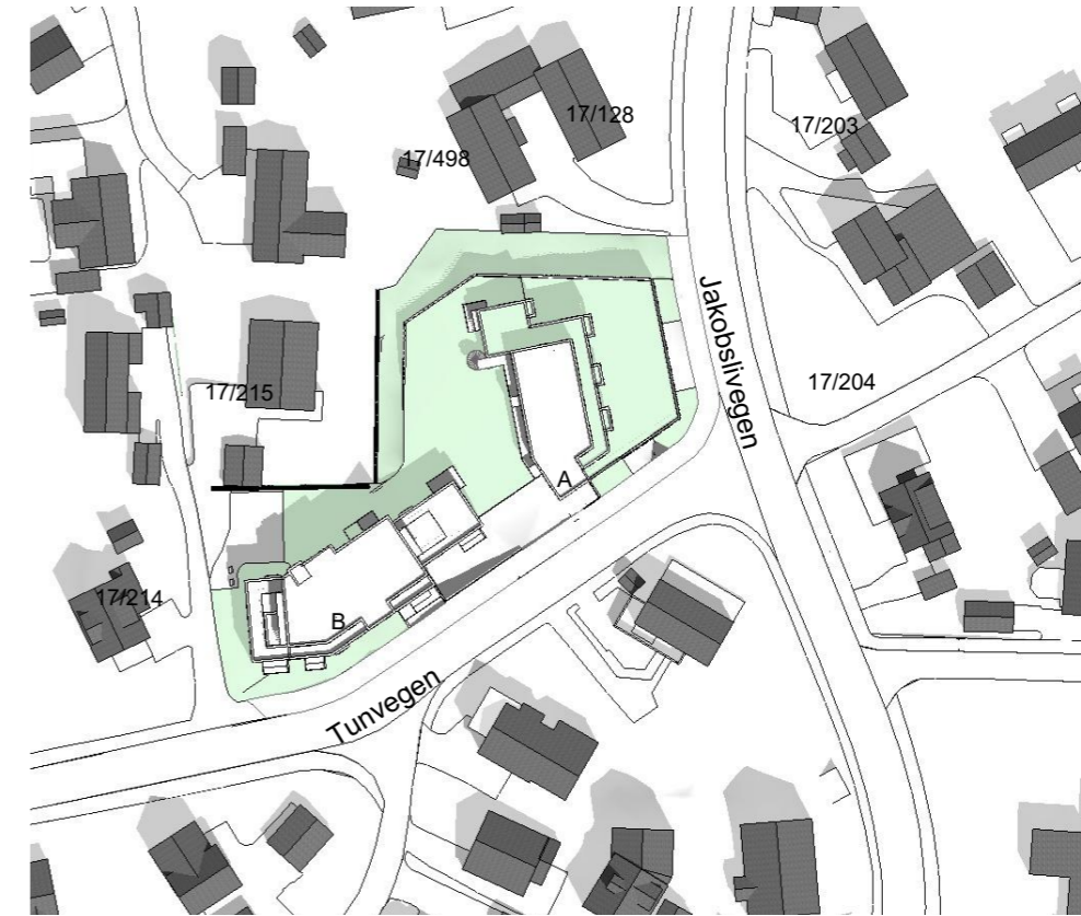
21. Juni kl 12:00