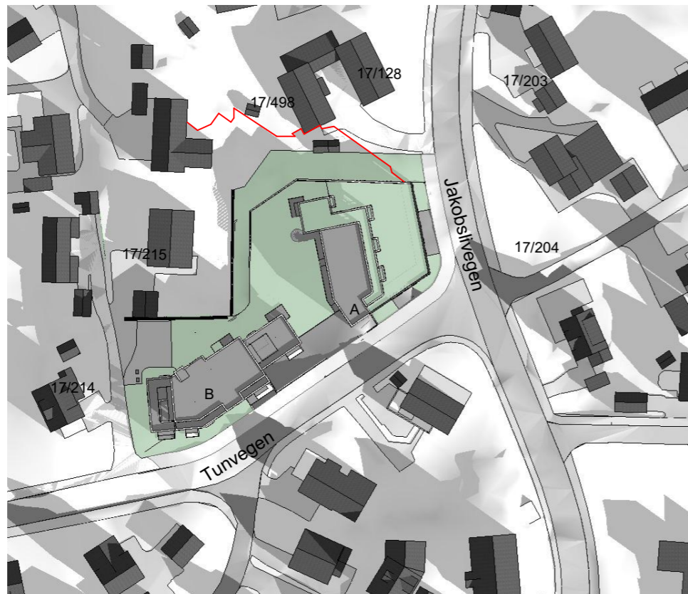
23. Mars kl 09:00