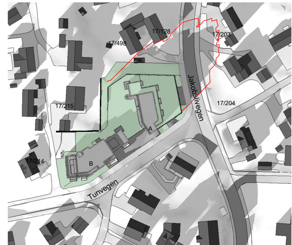
23. Mars kl 15:00

— = omriss skygge ved planforslag 05.07.19