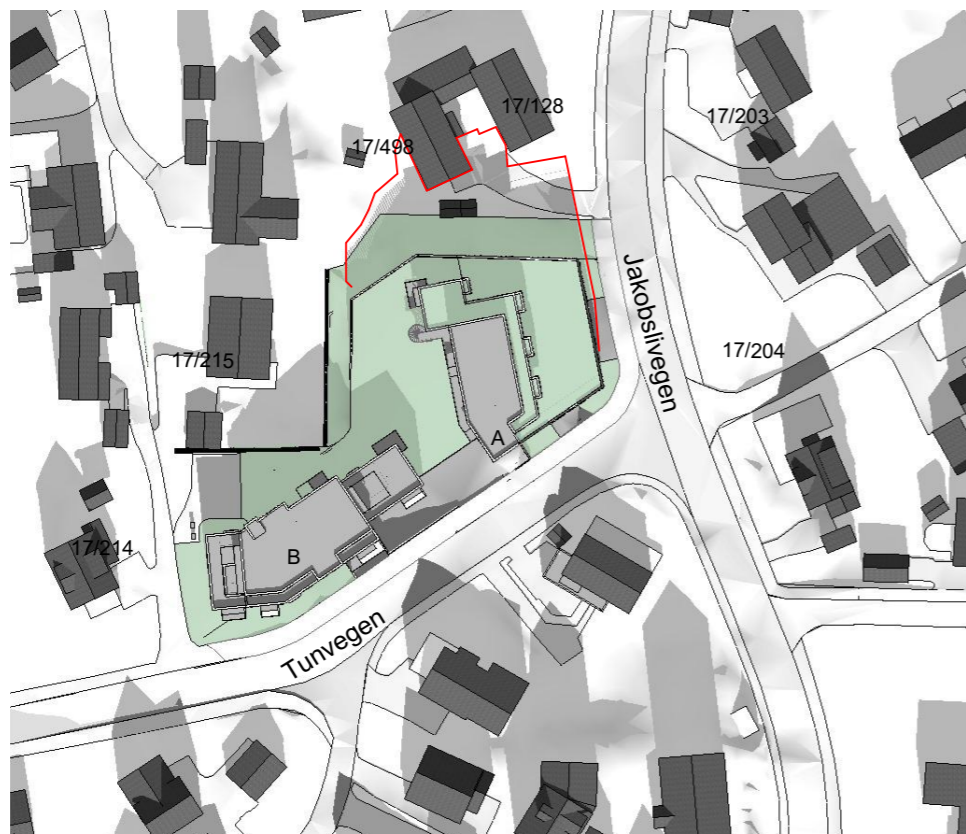
23. Mars kl 12:00