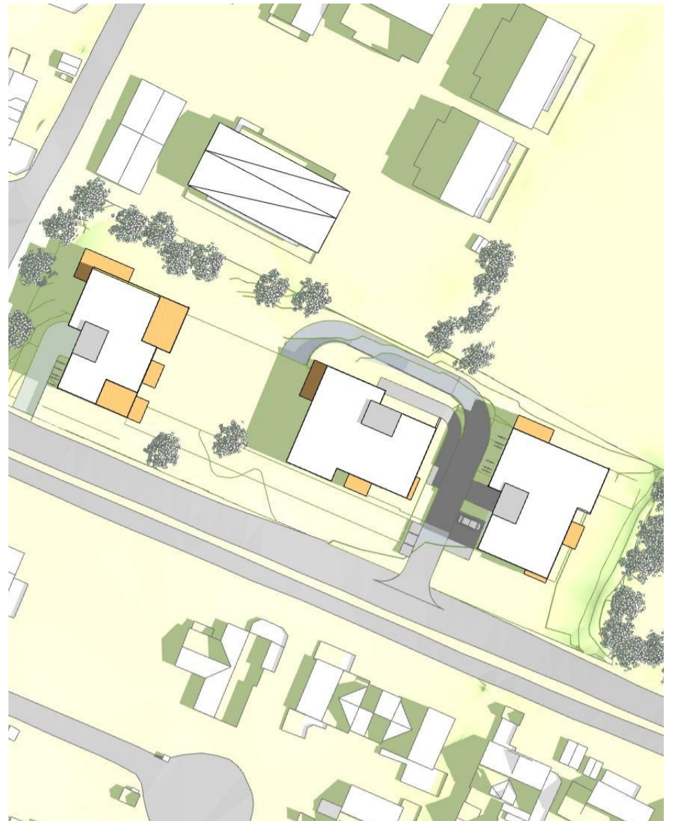
23. juni, kl. 15.00