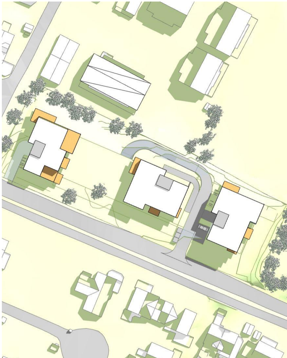
23. juni, kl. 12.00