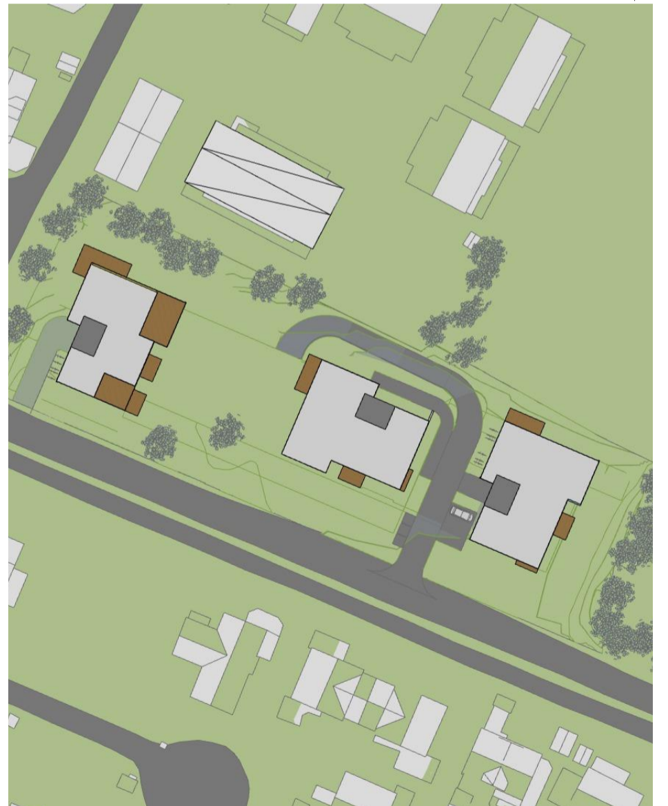
22. april, kl. 21.00