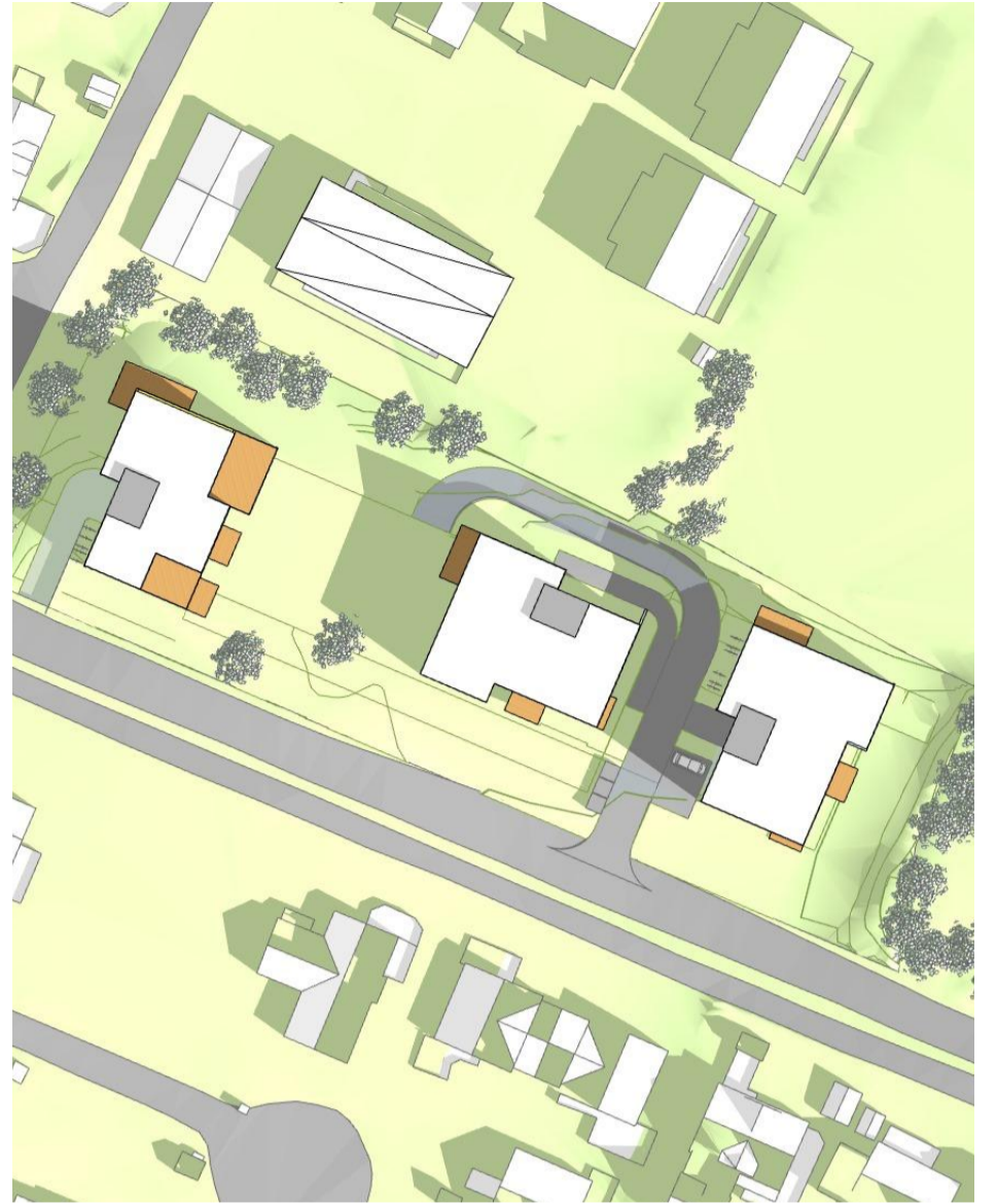
22. april, kl. 15.00