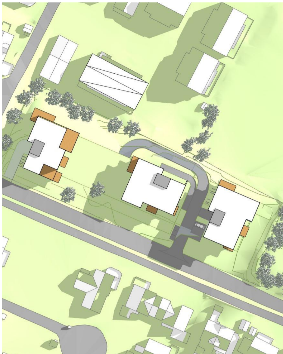
21. mars, kl. 12.00