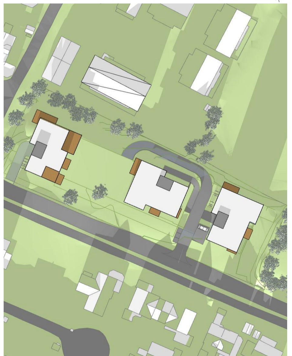
23. juni, kl. 21.00