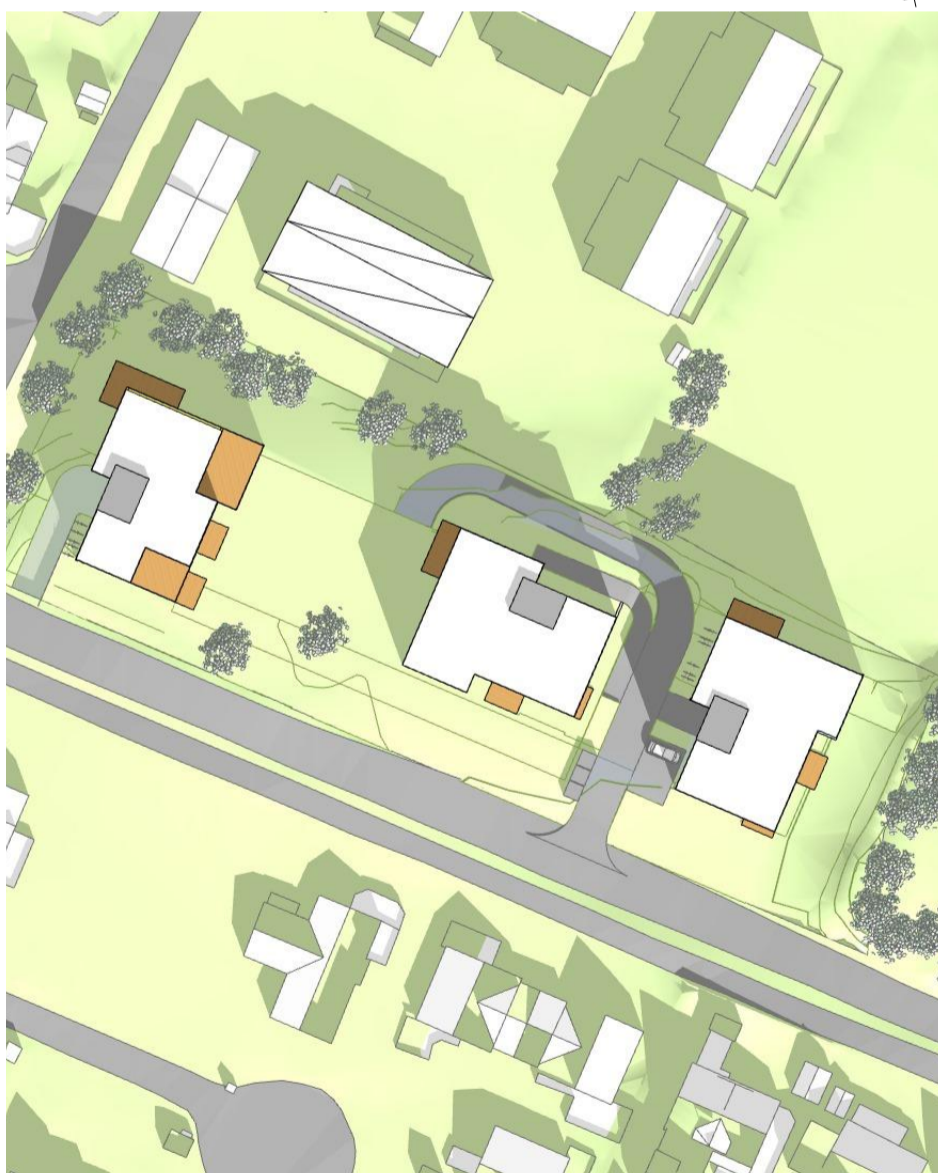
23. juni, kl. 18.00