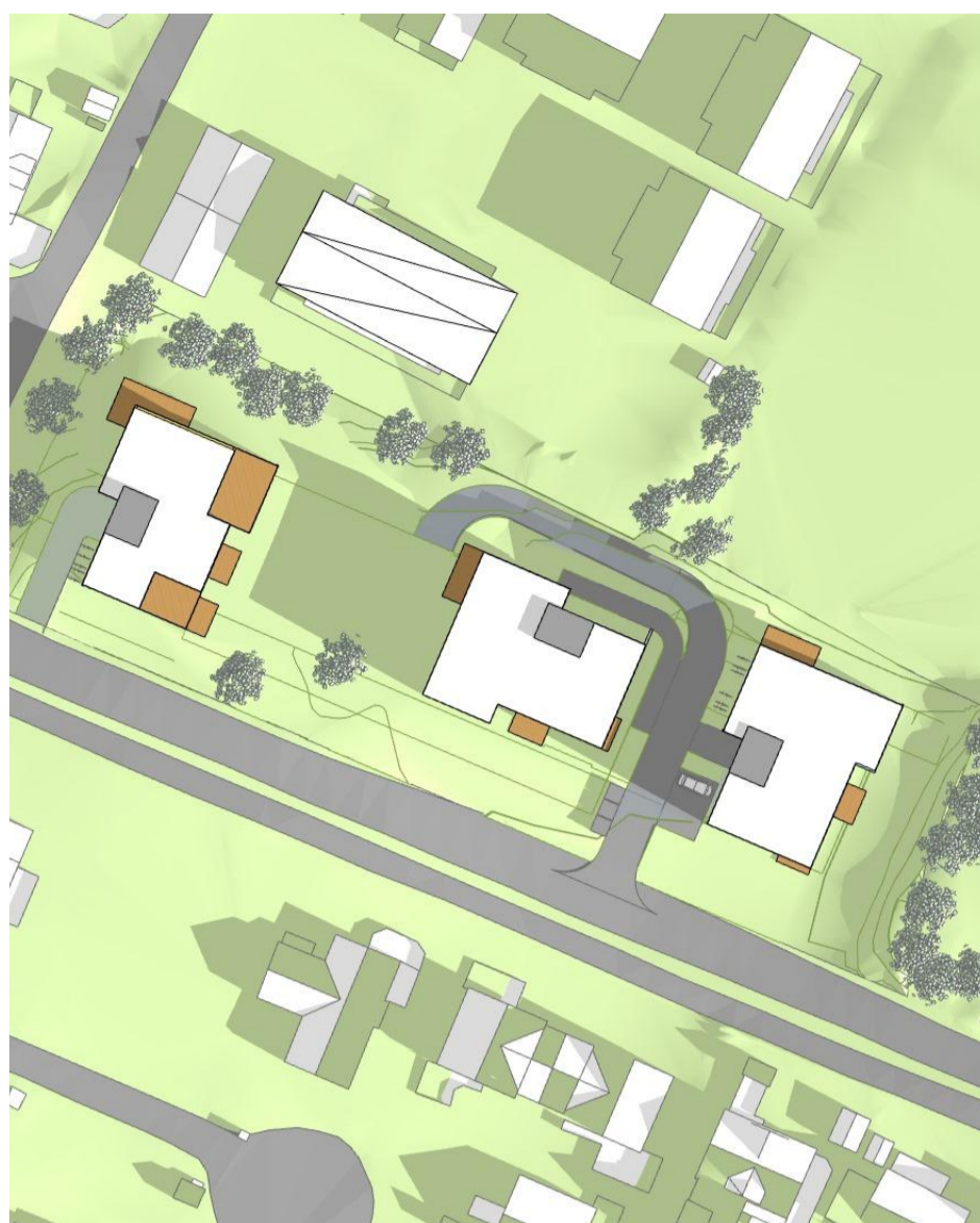
21. mars, kl. 15.00