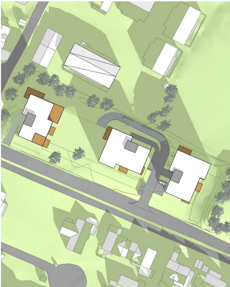
22. april, kl. 18.00