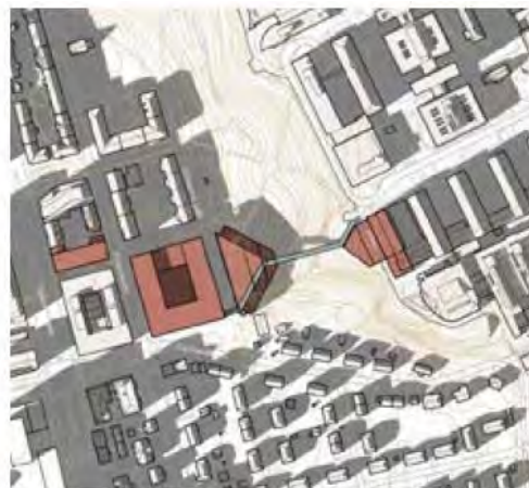
23. mars kl. 16:00