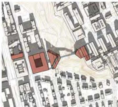
23. mars kl. 12:00

Hestehagelunden som er skråningen i parken nærmest oss i sørøst blir ødelagt som park dersom det bygges her. Bebyggelsen vil hele vinteren gi skygge i Vestskråningen foran våre boliger som i dag har sol hele året, og som gir unike lyskvaliteter i mørketida. Vi har en lekeplass sørøst på vår eiendom som brukes av alle barn i nabolaget. Ny bebyggelse i parken i tillegg til nye bygg på parkeringsplassen Hestehagen, vil skyggelegge lekeplassen hele dagen, noe som selvfølgelig vil redusere bokkvaliteten vår og gjøre det mindre attraktivt å flytte hit med barn. Vi skjønner at parkeringsplassen vurderes som byggetomt, men vi ber om at høyden holdes nede, slik at hage og balkonger mot vest beholder mest mulig sol. Vi lurer på om det å holde tilbake sol- og skyggediagram er mangelfull saksopplysning, i strid med plan- og bygningsloven. Under har vi klippet inn soldiagrammene vi fant i mulighetsstudien. Diagrammet viser at vår eiendom og våre uteareal, inkludert parkarealene vi har utsikt til, vil bli liggende i skygge hele vinterhalvåret, og at lekeplassen også om sommeren får skygge midt på dagen.