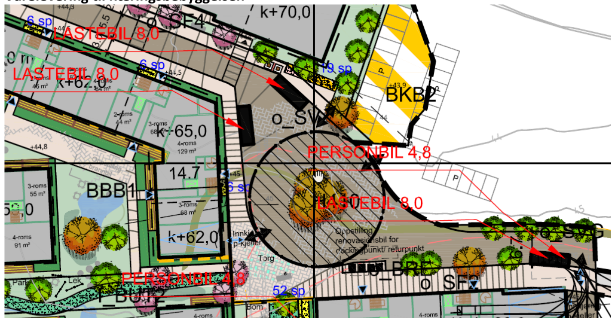
Figur 1: Areal for av- og pålossing er markert med svart rektangel på illustrasjonen

Næringsbebyggelsen skal ikke benyttes til forretning/ dagligvare, og det vurderes derfor slik at det ikke er behov for å sette av areal til vareleveranser inne på eiendommen. Varebiler og mindre lastebiler kan, som i øvrige bymessige områder, parkere for av- og pålossing på viste plasser i offentlig vei, etter regulert snuplass (se figur 1).