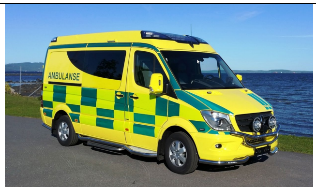
Figur 3: Større vare-/ sykebiler, som Mercedes Sprinter, kan ha en høyde på inntil 3,1 meter og vil ikke kunne benytte parkeringskjeller som boligadkomst