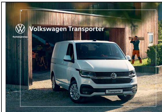
Figur 2: Volkswagen Transporter har høyde på inntil 2,2 m og kan benytte inngang fra parkeringskjeller

Håndverksbiler som ikke kan benytte parkeringskjeller parkerer i Gildheimsvegen, men kan ved behov benytte de markerte avlessingsarealene for å sette fra seg verktøy/ varer; tilsvarende løsningen for varelevanser som beskrevet under.