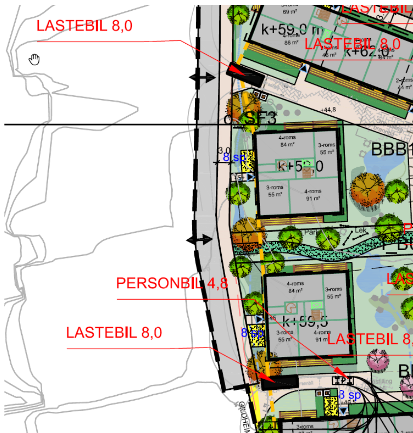
Figur 5: Areal for av- og pålessing er markert med svart rektangel på illustrasjonen

Avlessingsareal for varebil er markert på illustrasjonene, og ligger i avstand fra 8 meter til 45 meter fra inngangsdør. Inngang lengst sør ligger 60 meter fra. Her kan varebil i enkelttilfeller rygge et stykke ned i gangveien.