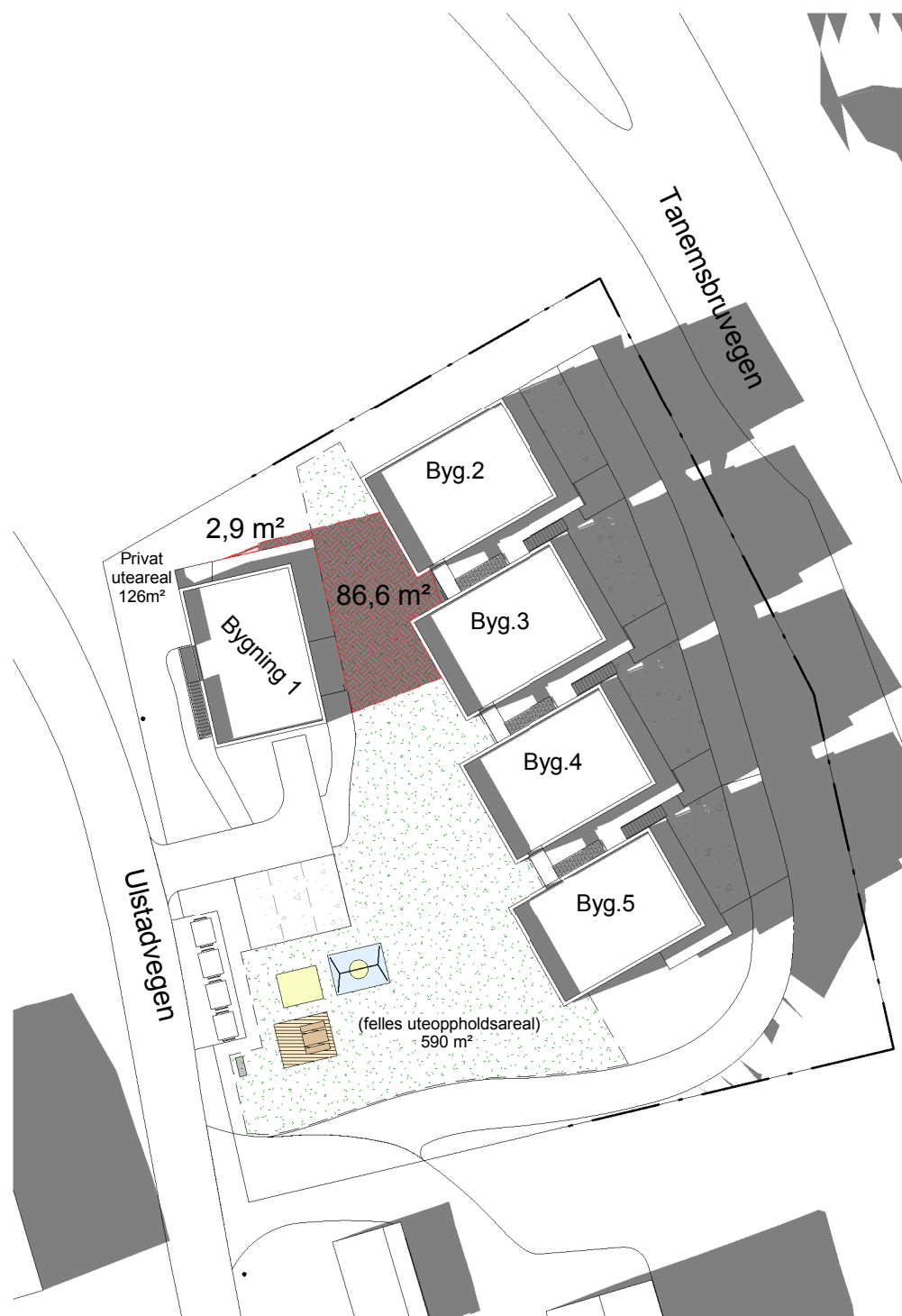
1 Sol/ skygge 23.juni kl 1500 1 : 500

Felles uteoppholdsareal på bakken: 590 m 2 - 86,6 m 2 i skyggen = 503,4 m 2 i sol (85,3%)