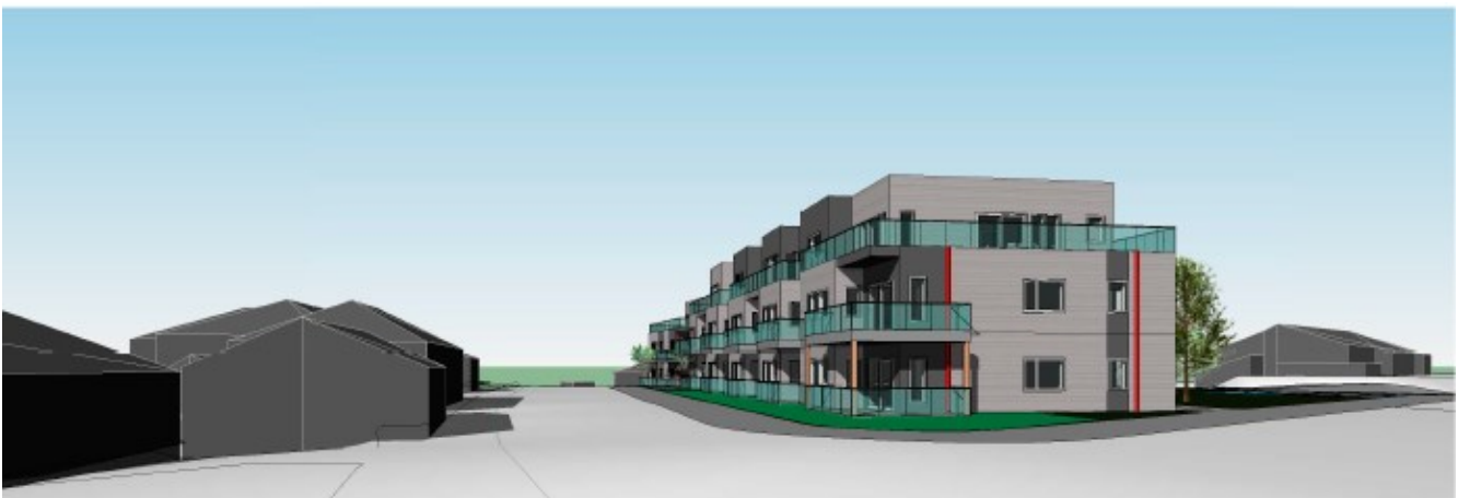
Figur 2 – Tre etasjer høyt med inntrukket tredje etasje.