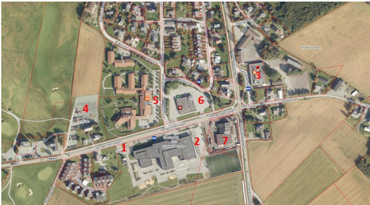
Luftfoto av Spongdal lokalsentrum

Spongdal er et lokalt sentrum hvor mange av de funksjonene som folk trenger i hverdagen er samlet på et konsentrert område inkludert kollektivforbindelse til byen. Sentrum er omgitt av landbruksareal.