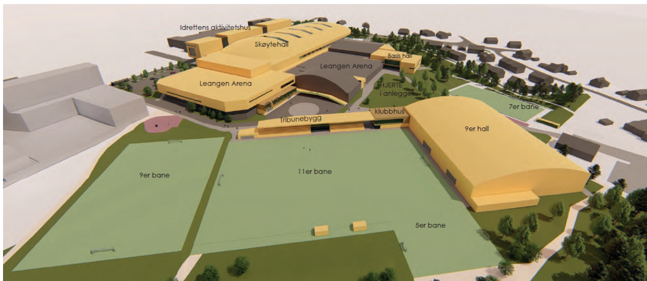
Fugleperspektiv fra nord, som viser anlegg og bebyggelse i planen.

Planområdet er avsatt til idrettsanlegg og grønnsstruktur i kommuneplanens arealdel 2012-2024. Deler av grønnsstrukturen foreslås regulert til idrettsformål, men med hensynssoner for å ivareta grønnsstruktur og naturmiljø. Planforslaget vurderes i hovedsak å være i tråd med kommuneplanens arealdel. Planforslaget følger også hovedgrep i planprogrammet for Leangen-området (vedtatt 18.1.2018). Naturaksen og aktivitetsaksen er sett i sammenheng med detaljregulering av Tungavegen 1. Planforslaget er også samordnet med reguleringsplan for Tungaveien 1 når det gjelder forbindelseslinjer, 9-erbane og søppelsuganlegg.