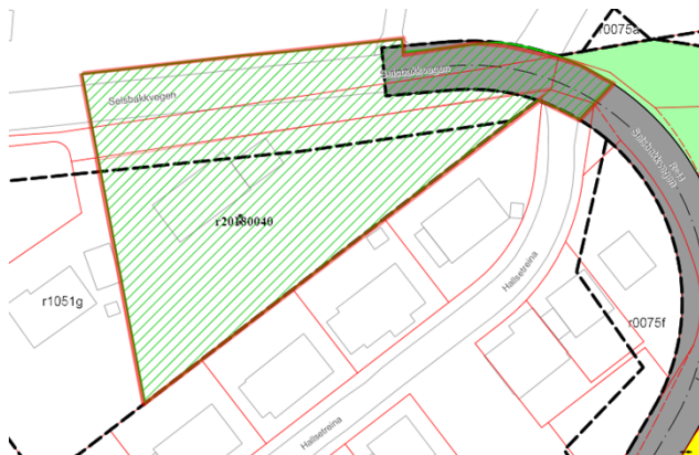
Figur 3: Omriss av planforslag, dagens plangrenser og dagens eiendomsgrenser

Etter offentlig ettersyn, kommenterte Fylkesmannen i Trøndelag at ettersom en del av planområdet ligger utenfor det som er definert som lokalsenterområde Hallset, vil ikke kravet til såpass høy utnyttning som seks boliger per dekar være absolutt her. Etter en ny vurdering av planforslaget, mener Kommunedirektøren at forslaget allikevel er akseptabelt, og at det har løst forholdet til topografi og typologi på en tilfredsstillende måte.