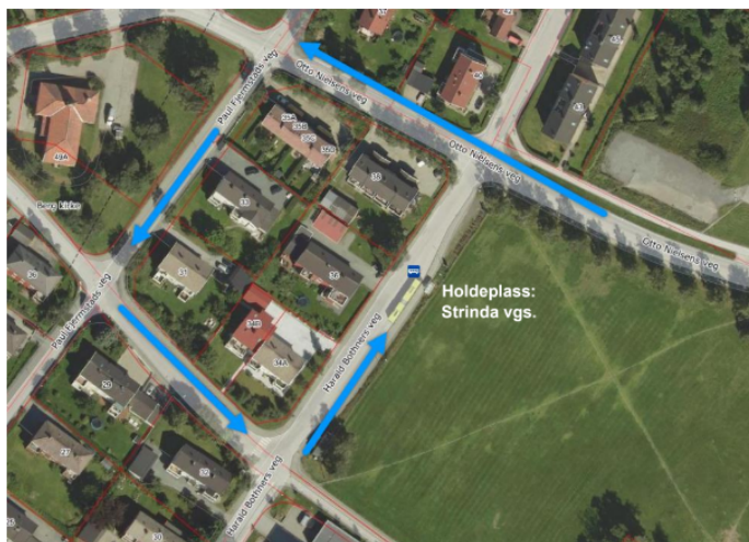
Figur 44: Busslinje 22 kjører rundt kvartalet. Frekvens hvert 10. minutt i rush, elles hvert 20. minutt. (Finn.no/kart)

Bakgrunnen for at sykkelvegen legges på sørsiden er at man ønsker å unngå at de syklende kommer i konflikt med busslinje nr. 22 som bruker kvartalet til å snu.