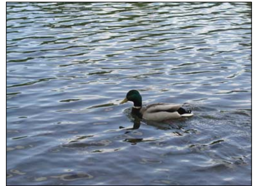
Stokkand i Nidelva

Nidelvkorridoren er et svært viktig natur- og viltområde med mange arter.