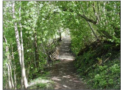
Tursti ved Nidelva