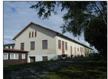
4. Renholdsverkets fabrikk