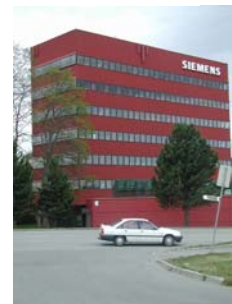
5. Siemens høyblokk