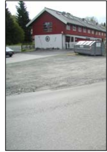
1. Sorgenfri gård, låve ombygget