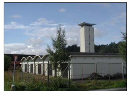
7. Sivilforsvarets lagerbygg