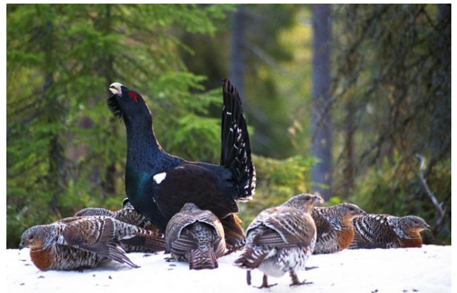
Tiurleik med tiur og røy.

Leiken er et vakkert og spennende skue med oppvisning av flotte fjærdrakter, slåsskamper mellom hannene og parringer. Det hender at de vanligvis sky tiurene blir så opphisset at de angriper alt som rører seg. Da kaller vi dem spilleagle.