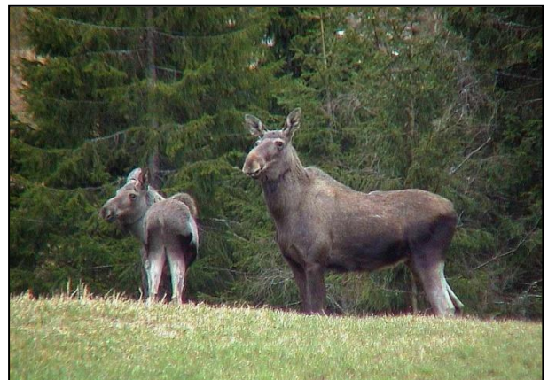
Elgku med kalv. Det er stort produksjonspotensiale i elgstammen i Trondheim. Her finnes mange produktive kyr.

Det gjøres også informasjonsarbeid og bevisst avskyting av elg i trafikkerte områder både under ordinær jakt og ellers ved behov.