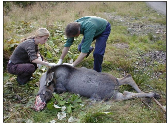
Obduksjon av elg - Hva er dødsårsaken? Årlig er det en avgang på mellom 5-20 elg utenom ordinær elgjakt. Årsakene til avgangen er forskjellig, trafikken tar en god del elg.