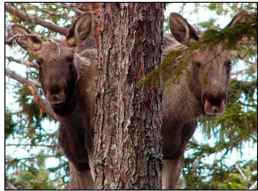
Elg i Bymarka.