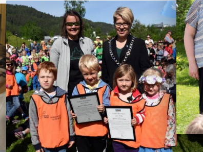
Vinner GBB pris 2016