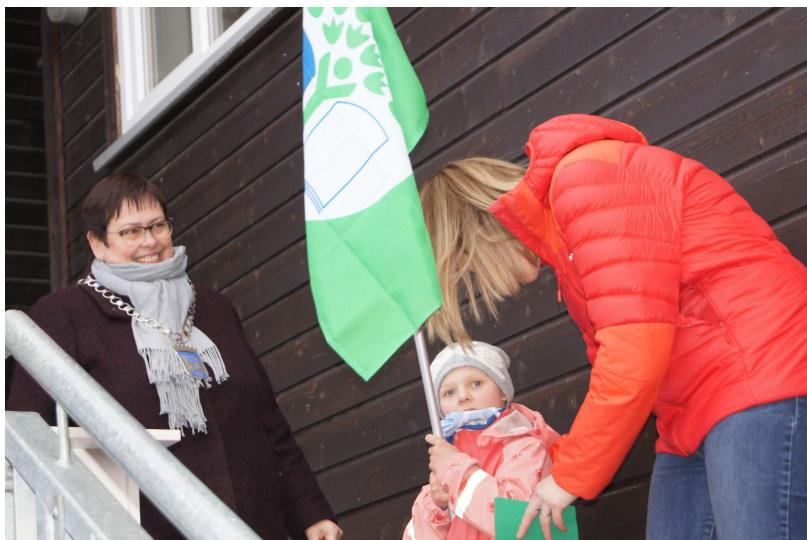
Grønt Flagg ved Horneberg barnehage

https://www.trondheim.kommune.no/aktuelt/utvalgt/andre-omrader/miljo/gronn-barneby/