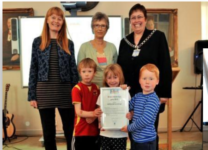
Vinner GBB pris 2013 Bakklandet barnehage