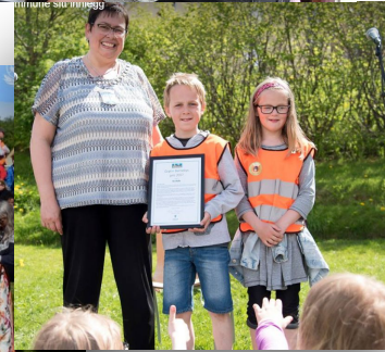
Vinner i 2017 Ila skole