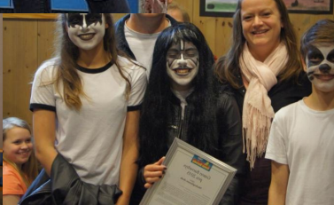
Vinner GBB pris 2015