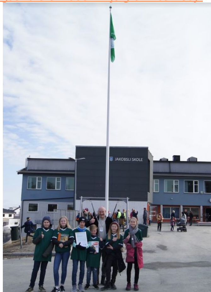
Grønt Flagg ved Jakobsli skole, 4.april