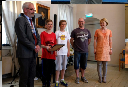
Vinner GBB pris 2014 Eberg skole