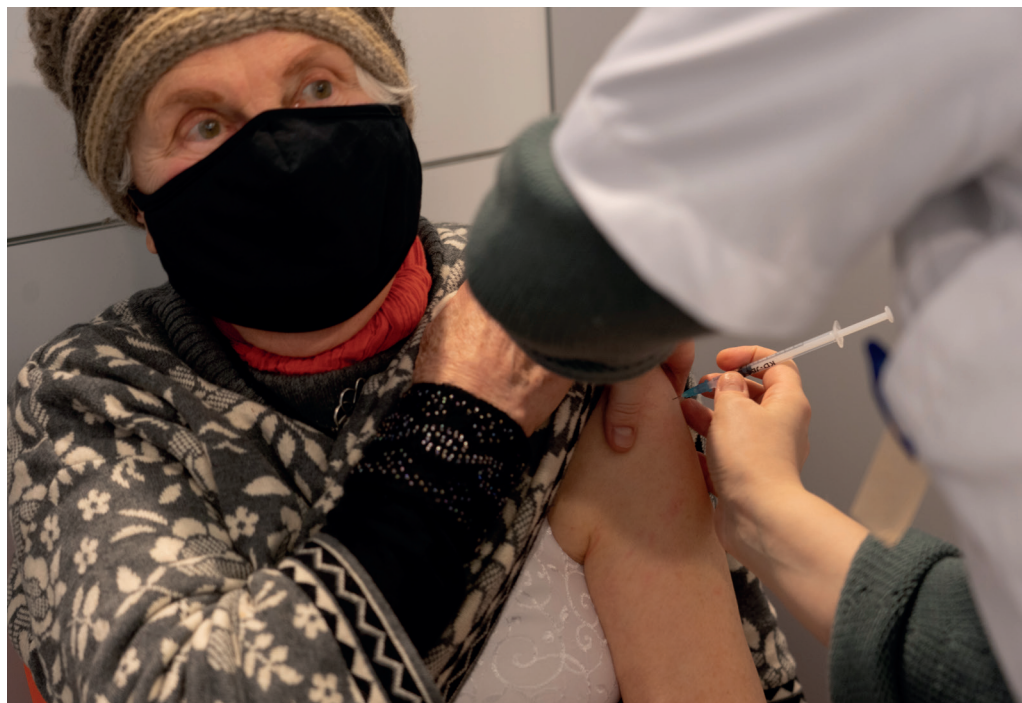
Som seniorinnbygger står du blant de første i køen for å få vaksine mot covid-19. Bildet er fra vaksineringen i Statens hus tidligere i februar.